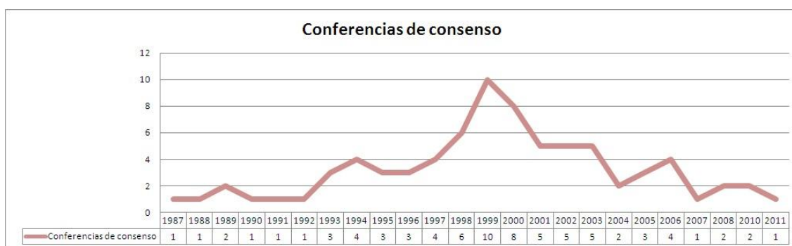
Figura 2: Realización de CC año por año desde 1987 al 2011.

Con respecto a la evaluación de las conferencias, existen muchos criterios a veces explícitos pero a menudo implícitos (Rowe & Frewer, 2005). La mayoría de las veces se focaliza en el impacto en el debate público y político concluyéndose en que posee escasos o nulos efectos en estas arenas (Guston, 1999). Pese a esta tendencia, existen experiencias que atestiguan el impacto potencial de las conferencias como lo demuestran Hudspith y Kim (2002) quienes identifican cómo fueron seguidas gran parte de las recomendaciones de un panel ciudadano en Ontario, Canadá. Por otra parte, Kleinman y colaboradores (2007) proponen una serie de metas y criterios para evaluar el éxito de la conferencia, entre ellas se destaca la diversidad de los participantes, la calidad del proceso del debate, el empoderamiento de los ciudadanos participantes y el impacto en el debate público y en la política.