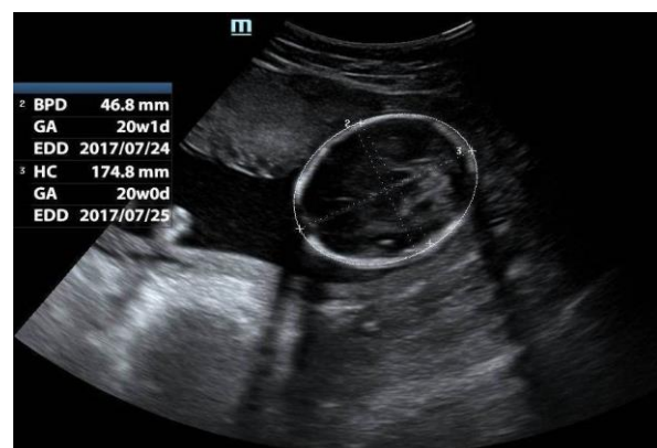
شکل ۳. حاملگی فعلی