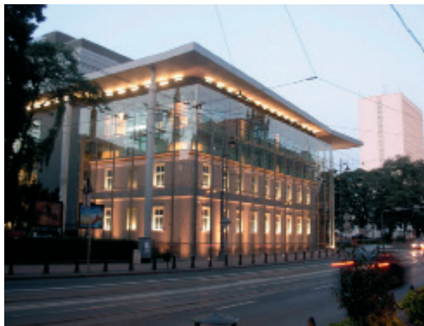
Ryc. 1. „Drukarnia” Dom Mody w Bydgoszczy – kopia budynku dawnej drukarni Gruenauera w szklanym „akwarium” centrum handlowego