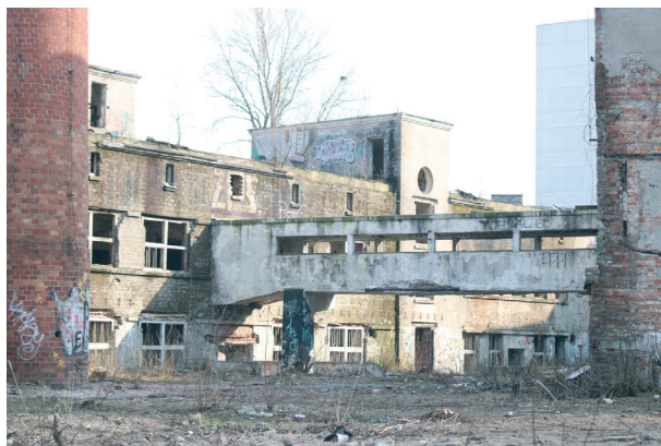
Ryc. 6. Porzucone budynki dawnych Krajowych Zakładów Telefunken S.A. przy ul. Owsianej 14 w Warszawie