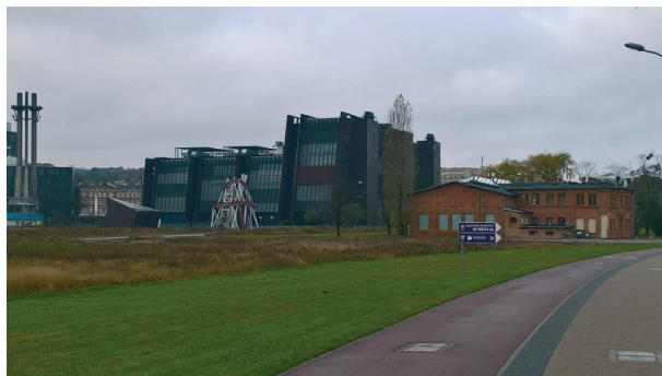
Ryc. 5. Kontrast pomiędzy historycznym budynkiem Sali BHP Stoczni Gdańskiej, a potężną bryłą ECS