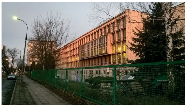
Ryc. 3. Budynek biurowy d. drukarni im. Rewolucji Październikowej, Warszawa ul. Mińska 65