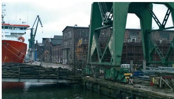
Ryc. 4. Zabudowa dawnej Stoczni Cesarskiej, pozbawiona kontekstu „Solidarności” poprzez budowę nowej, pozbawionej „ducha stoczni” siedziby ECS

Nowoczesny budynek, o niewątpliwie wysokiej funkcjonalności, jest jednak obcy swoją formą architektoniczną, wielkością, materiałami elewacyjnymi (imitacja porzewiałych blach okrętowych?) w ukształtowanej w XIX wieku przestrzeni stoczniowej. Odcięty jest przy tym od autentycznej jeszcze tkanki dawnej stoczni nową miejską ulicą, przeprowadzoną przez tereny, na których kilka lat temu stały budynki stoczniowe i XIX-wieczna willa dyrektora Stoczni Cesarskiej. Świadomie lub nieświadomie odrzucono autentyczność materii i ducha dawnej stoczni aby stworzyć „zimną”, nowoczesną budowlę mającą tego ducha chronić i pielęgnować... 44 .