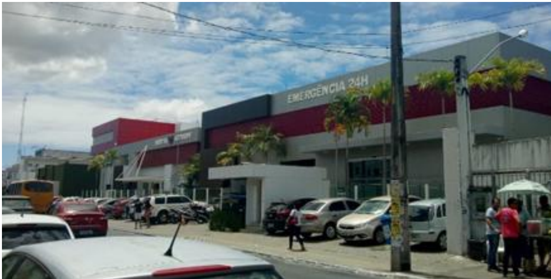
Foto 1 - Aspectos da urbanização com edificações em concreto na Avenida Central, Bairro Cajazeiras. Salvador-Bahia, 2019.