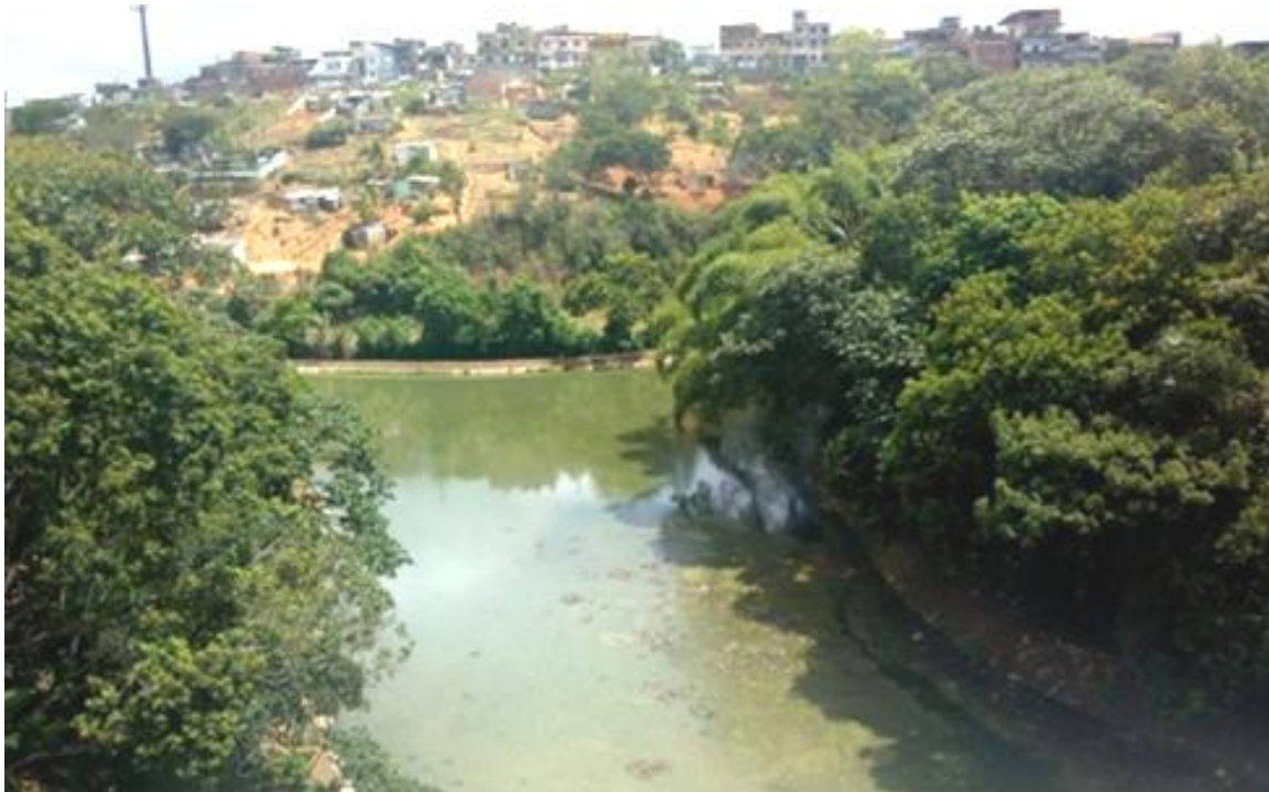
Foto 3 - Lagoa de despejo de efluentes domésticos pertencentes à Empresa Baiana de Saneamento. 2019. Bairro Cajazeiras.