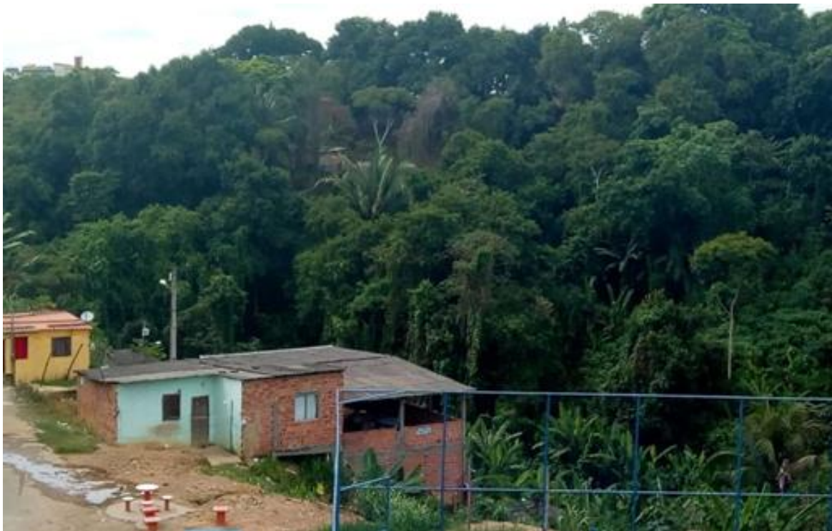
Foto 2 - Avanço das construções sobre as encostas no bairro de Cajazeiras VI.