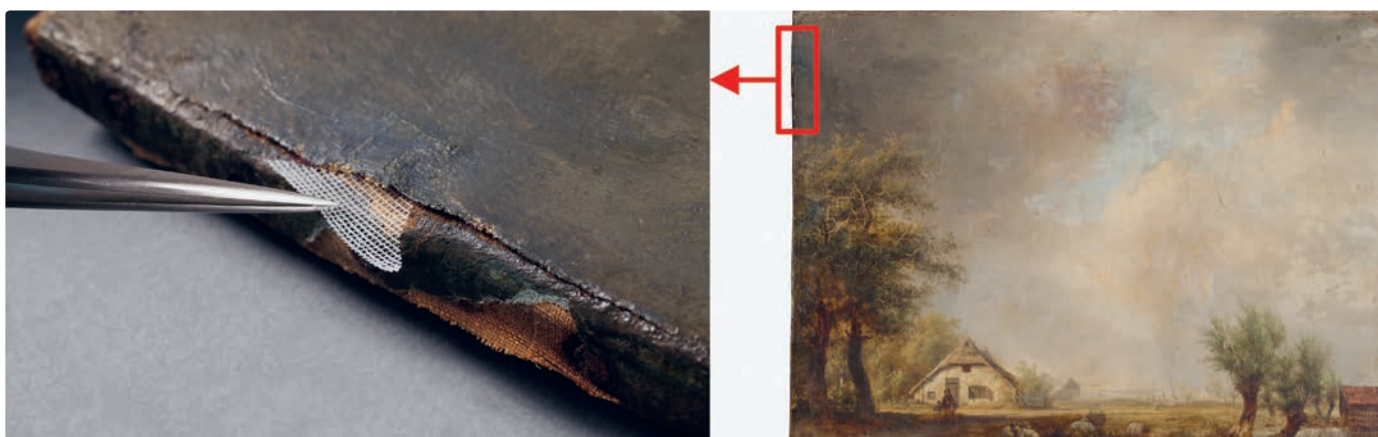
Abb. 1: Ein Leinwandgemälde (rechts) wurde vormals durch ein zweites Gewebe hinterklebt. Die Verklebung löst sich entlang der Ränder. Klebstoffgitter werden zwischen die zwei Leinwände geschoben (links) und dort mit wenig Wasser aktiviert.

An mehreren Leinwandgemälden konnte diese Technik bereits erfolgreich eingesetzt werden. Für gute Ergebnisse müssen sich die Dimensionen der Gitter im Bereich von ein paar wenigen Hundert Mikrometern bewegen. Als Geometrie werden derzeit quadratische Gitterstrukturen verwendet, die durch hexagonale Strukturen abgelöst werden sollen, die sich herstellungs- und anwendungstechnisch als vorteilhaft her-