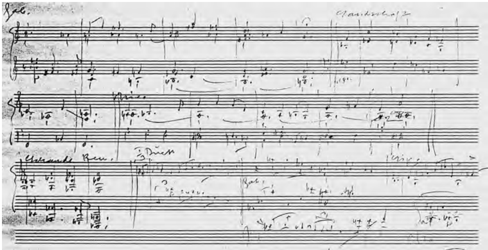
ABBILDUNG 3 Erste Skizzen zu Das Schloss Dürande , Bleistiftskizzen, 10 Seiten, S. 1 (Sammlung Traut Mohr, Basel; Fotokopien unter den Beständen des Othmar-Schoeck-Forschungsarchivs in der Musikabteilung der Zentralbibliothek Zürich)

Musikalisch poltert er nun auch nicht mehr drauflos, sondern tastet sich in Venzagos Neufassung bei »es ist so still« (3 Takte vor Ziffer 64) vorsichtig mit der Wechsellnote vor, die das molto espressivo der Bratsche vorwegnimmt und verdoppelt; das chromatische Total der zwei Takte und der Unheil dräuende Posauneneinsatz werden durch den Tritonus auf das »mir graut« verstärkt. Das frühere baritonale Gebrüll wird ersetzt durch eine chromatische Steigerung und den plötzlichen Registerwechsel in die Höhe, der die tiefe Einsamkeit über der Tremologrundierung fast physisch erlebbar macht. Schmach und Schande sind nun kein Movens mehr. Der Begriff Schande kam zwar schon bei Eichendorff vor, aber nur gerade zweimal; bei Burte sind es dann zehnmal, bei Micieli wieder nur vier – allerdings: Bei Schoeck selbst war »Schande« eine der ersten musikalischen Ideen, die er skizziert hatte (Abbildung 3, Anfang der 3. Akkolade). Und ganz am Ende der Oper ergänzte Schoeck Burtes Entwurf um ein »Gerächt der Schwester Schande!«