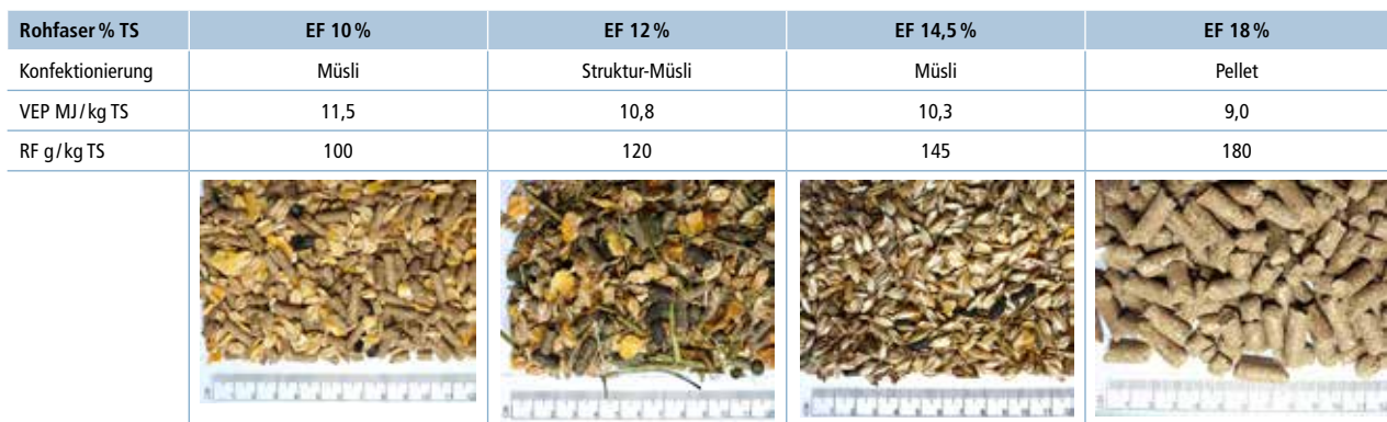
Tab. 1 | Zusammensetzung der getesteten Ergänzungsfuttermittel.

EF: Ergänzungsfuttermittel VEP: Verdauliche Energie Pferd RF: Rohfaser TS: Trockensubstanz