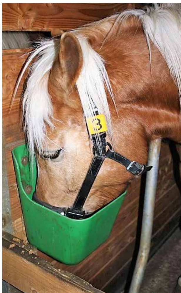
Versuchspferd mit dem Equiwatch®-Halfter zur Messung von Futteraufnahmezeit und Kaufrequenz.