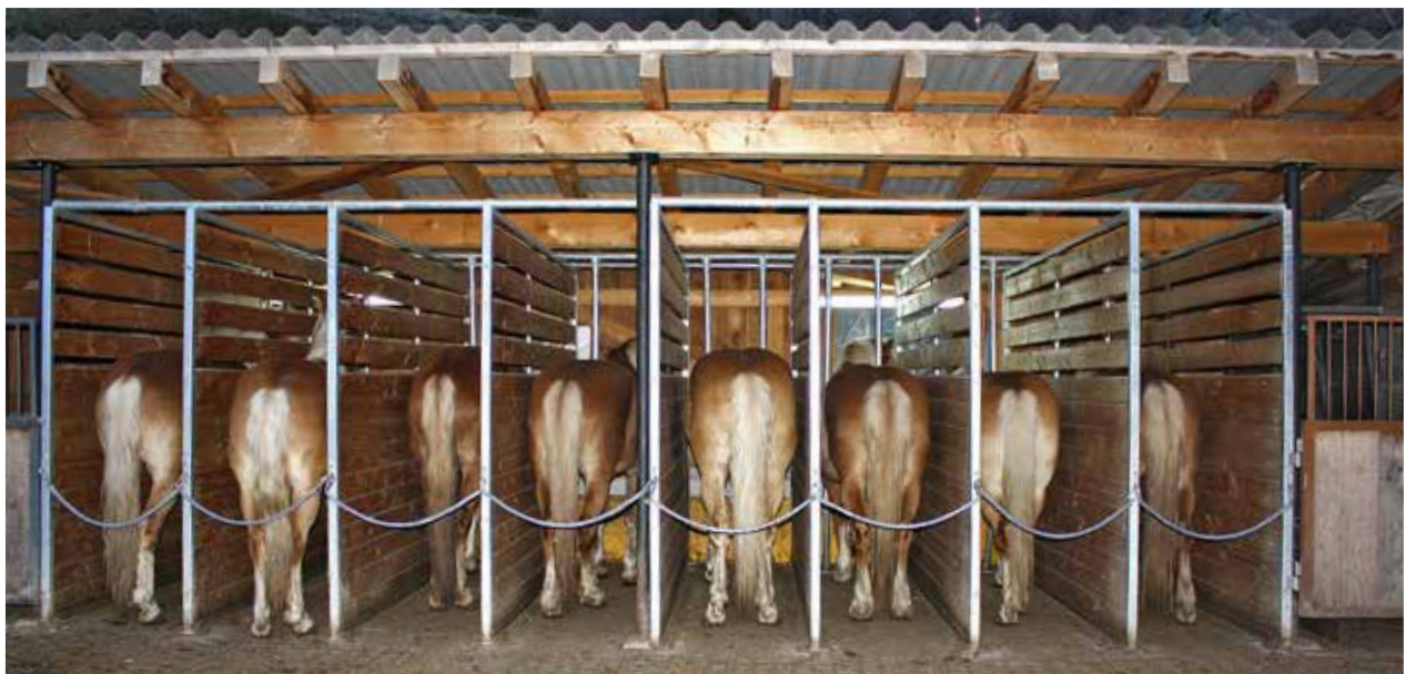
Abb. 1 | Versuchspferde in den Fressständen an den Messtagen.

Für die unterschiedlichen EF betrugen die Futteraufnahmezeiten 11,6 bis 15,8 min pro kg (Tab. 2; Abb. 2), hierbei nahmen die Pferde im Mittel 68 \pm 15 g pro min von den verschiedenen Futtermitteln auf. Die längsten Futteraufnahmezeiten mit den geringsten Aufnahmemengen pro min wurden für die EF mit den RF-Gehalten von 14,5 % und 18 % festgestellt ( p < 0,05 ). Deutlich schneller wurden die beiden EF mit einem RF-Gehalt von 10 und 12 % gefressen ( p < 0,05 , Tab. 2). Die Kauschläge variierten in der Summe zwischen 1136 und 1472 Schläge pro kg EF, wobei mittlere Kaufrequenzen zwischen 99 und 112 Schläge pro min festgestellt wurden (Tab. 2). Die höchste