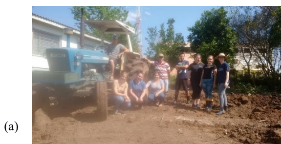
Figura 1 - Horta da Escola Estadual de Ensino Médio Ruy Barbosa, Novo Cabrais – RS. a) Gradagem com o auxílio de trator emprestado por vizinho da escola. b) Preparo dos canteiros

O espaço disponibilizado pela Escola Estadual de Ensino Médio Ruy Barbosa para a implantação da horta media 88 m 2 (onze metros de comprimento por oito metros de largura). Era uma área com desnível e muitos caules e raízes de árvores, havendo a necessidade de muito trabalho até ser possível montar os canteiros e fazer o cultivo das plantas. Devido a isso, desde o início das atividades de implantação da horta, em agosto de 2017, ficou evidente a importância da comunidade na realização de atividades da escola. A comunidade se fez presente quando a área da horta foi cercada, nas atividades de gradagem e na montagem dos canteiros (Figuras 1 e 2).