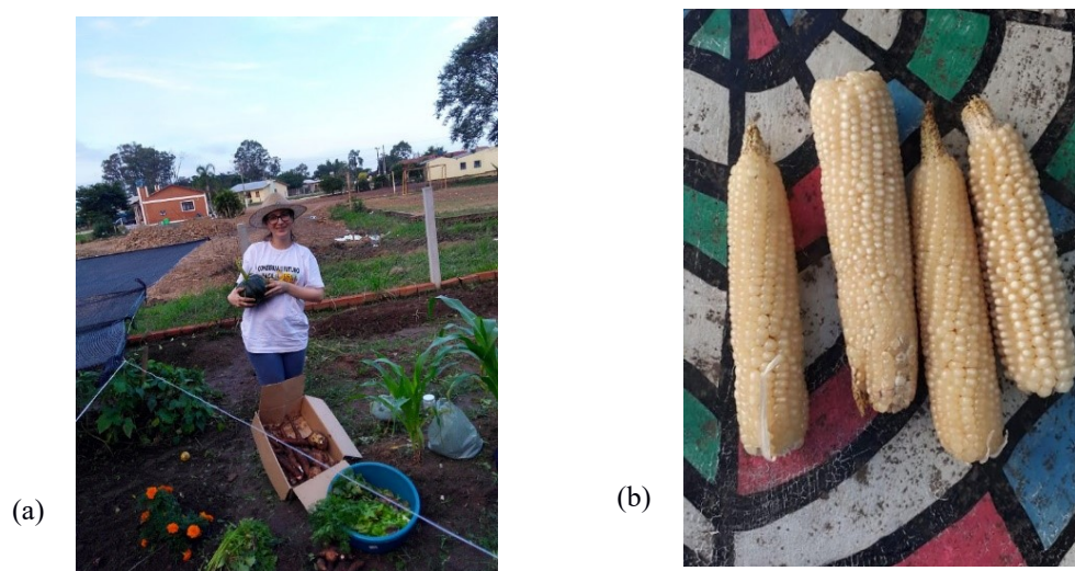
Figura 5 - Horta da Escola Estadual de Ensino Médio Ruy Barbosa, Novo Cabrais – RS. a) Colheita de hortaliças para a merenda na escola. b) Colheita do milho pipoca

Desde a primeira colheita, a produção da horta é utilizada na alimentação dos alunos, professores e funcionários da escola (Figura 5).