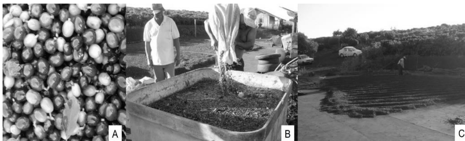
Figura 2 – Recomendações técnicas para o agricultor após o diagnóstico, colheita no pano e mais uniformidade de maturidade dos frutos (A), lavagem para separação dos frutos (B) e secagem (C).

Os alunos recomendaram aos produtores que colhessem o café no pano e os lavassem para separar os frutos verdes, cerejas e secos, como também secar na forma correta, e obter melhor preço de comercialização (Figura 2). Recomendaram-se produtos menos tóxicos ao meio ambiente no controle de pragas e doenças. O controle manual de plantas invasoras e o uso de adubação verde também foram recomendados. A análise de tecido foliar e de solo das propriedades proporcionaram a adubação mais consciente e adequada para as plantas.