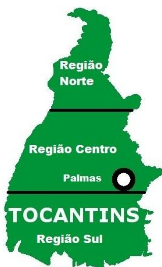
FIGURA – 2: Regiões feitas as coletas dos dados.