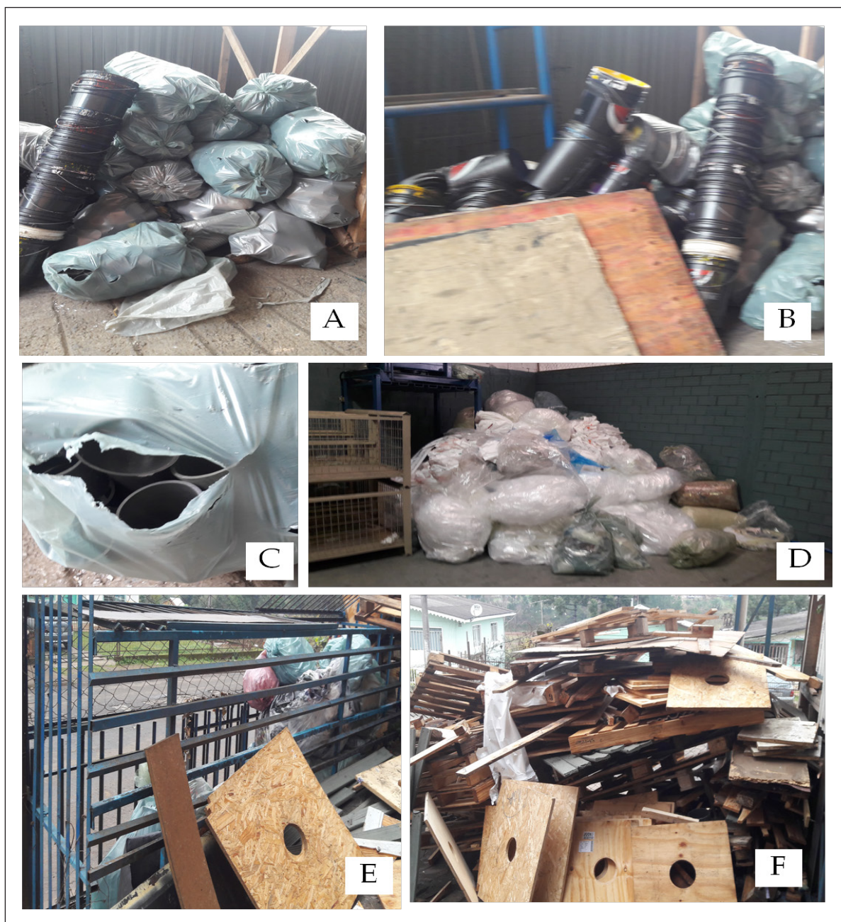
Figura 4. Principales residuos generados en el emprendimiento: (A) y (C) tubos; (B) Baldes limpios sin tinta; (D) plástico de diversos colores generados en el sector administrativo y en la producción; (E) residuos orgánicos, desechos y residuos sanitarios; (F) Madeira.

Conforme a la Figura 4. en cada sector se genera una cantidad de virutas (resto y trozos de plástico), pudiendo ser lisa o impresa. Los restos plásticos generados por la empresa proveniente del sector administrativo como el del proceso de producción son reciclados, el plástico se almacena en un lugar designado para esa operación y luego se procesa, obteniendo como producto final plástico burbuja.