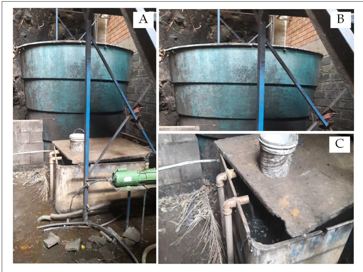
Figura 2 - Sistema de enfriamiento del efluente de la cámara instrusora componiendo un ciclo cerrado: (A) Sistema de enfriamiento; (B) Cisterna de almacenamiento y (C) Caja de enfriamiento con recirculación del efluente.

Para Fernandes, Neto y Mattos (2007) es viable económicamente y ambientalmente la utilización de sistemas de reaprovechamiento del agua de lluvia, ya que la escasez del agua es una cuestión que estamos evidenciando en la actualidad, este proceso también presenta otros beneficios indirectos como la minimización de crecidas e inundaciones, y el agua se almacena y se utiliza para el consumo. Según Minikowski y Maia (2009) el proceso de utilización de agua de lluvia debe ser un sistema complementario junto a la distribución de agua del municipio, donde si se utiliza ese sistema en meses con bajo índice pluviométrico hace imposible el proceso de utilización de agua de lluvia. De acuerdo con Nascimento, Fernandes y Yoshino (2016) es necesario desarrollar un balance hídrico para una mejor eficiencia del proceso, sin embargo, la utilización como un sistema complementario del abastecimiento de agua, presenta una alternativa viable. Ouriques et al., (2005) complementa que el aprovechamiento del agua proveniente del sistema pluvial es de suma importancia, representando un sistema que puede disminuir los gastos con la utilización de recursos.