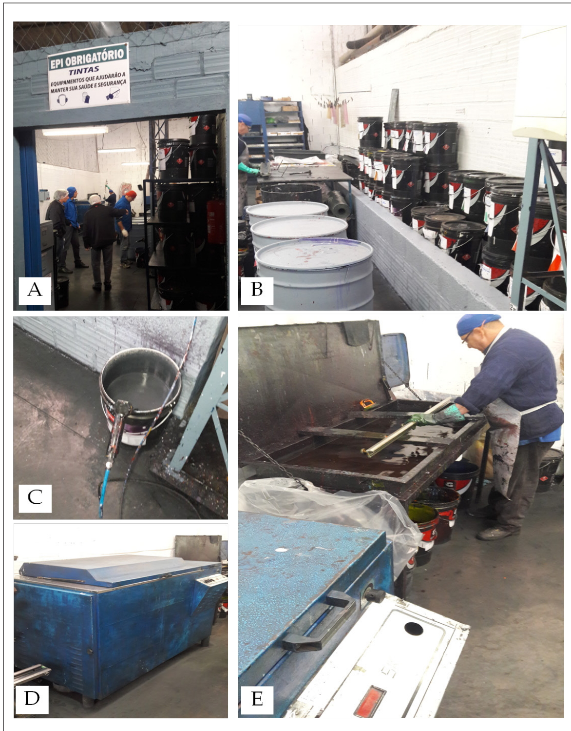
Figura 3 - Sistema de generación de residuos líquidos (disolventes): (A) lugar de lavado de piezas y manejo de disolventes; (B) almacenamiento de pinturas con adición del solvente tamizado; (C) Sistema de Lavado; (D) Bomba de lavado; (E) Lavado de piezas con resto de tinta.

Según Lobato y Lacerda (2013) es necesario monitorear y acompañar el proceso de manipulación de los solventes, ya que el mismo presenta un alto grado de toxicidad, necesitando análisis de los colaboradores que manipulan ese material. Sin embargo, según lo presentado (Figura 3.) la empresa del