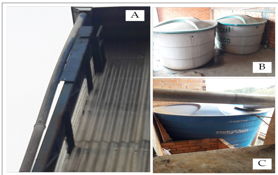
Figura 1 - Sistema de aprovechamiento del agua de lluvia: (A) Sistema de recolección del agua de lluvia; (B) Sistema de almacenamiento de agua que pasó por el sistema de enfriamiento y agua de lluvia y (C) Caja de distribución del agua reaprovechada.

La empresa tiene los procesos de reaprovechamiento de agua, iniciando el primer proceso constituido por el aprovechamiento del agua de lluvia para el proceso industrial, hidrantes y vasos sanitarios - con la capacidad de 25.000 litros que atiende a la empresa en tiempos de sequía, no con el fin volumen necesario, según figura 1. El segundo está constituido por un proceso de enfriamiento del efluente que se forma en las instrusoras, De acuerdo con la Figura 2.