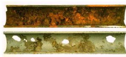
Gambar 2. Pipa air dibawah tekanan.

Graphitasi adalah isi besi yang dilepaskan melalui korosi pada suatu lokasi korosi lubang kecil meninggalkan karbon (mengkelupas). Hal ini sering terjadi pada besi cor kelabu. Graphitasi sama dengan korosi lubang kecil yaitu memperlemah struktur pipa tapi berbeda cara dalam membuat pipa bocor. Sering graphitasi tidak bocor sekalipun isi besi yang dikeluarkan semua sebab grafit yang ditinggalkan membentuk gumpalan yang dapat mencegah air dari kebocoran (lihat gambar 2). Bagaimanapun gumpalan ini dapat lepas karena pergerakan tanah, tekanan air dan lain-lain, yang menyebabkan kebocoran.