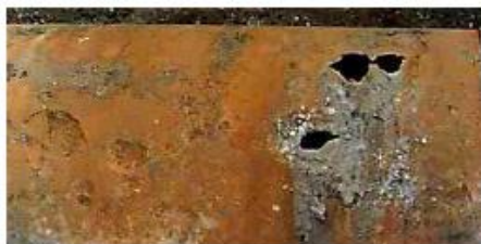
Gambar 1. Korosi eksternal pada pipa besi mampu bentuk, (sumber: Ranjani)

Korosi lubang kecil adalah korosi yang di lokalisir membuat lubang kecil pada dinding pipa, lubang kecil ini dapat membesar pada permukaan pipa sampai tembus ke dalam hingga menghasilkan kebocoran air (lihat gambar 1). Korosi lubang kecil sebagian besar menyerang pipa baja dan besi cor kelabu walaupun memungkinkan ada juga pada pipa mampu bentuk, lubang kecil ini ketika dalam dan besar dapat menyebabkan melemahnya struktur pipa, Pipa mungkin terdapat korosi lubang kecil karena tekanan eksternal yang berlebihan, memen bending, tekanan panas atau tekanan internal.