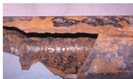
Gambar 3. Pemisahan yang panjang mengikuti garis korosi yang menyebabkan retak pada pelapisan (sumber: Ranjani)

Korosi dapat dimulai dari perlakuan transportasi dan pembuatan instalasi. Hal ini dapat membuat pipa cacat dan memperngaruhi kekuatan dari pipa. Sebagai contohnya suatu besi cor utama ditemukan goresan yang dalam dan panjang pada pelapisan saat pemasangan instalasi. Korosi yang berkembang dari goresan ini dan ketika mencapai kedalaman tertentu menyebabkan pipa retak karena goresan korosi (lihat gambar 3).