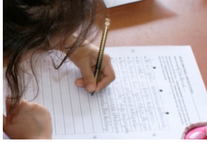
90° Altı f= 176 (% 43.3)