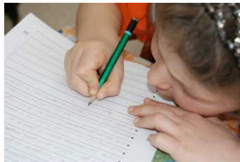
45°'ye Kadar Dışa Dönük f= 267 (% 65.6)