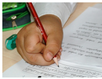
İşaret Parmağı ile Kesişik f= 85 (% 21.9)