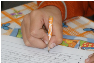
İki Parmak Baş ve İşaret Parmacı f= 339 (% 83.3)