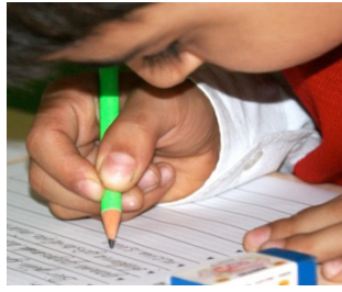
Üst Noktadan Kavrama f= 48 (% 11.8)