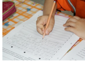
90° Üstü f= 230 (% 56.7)