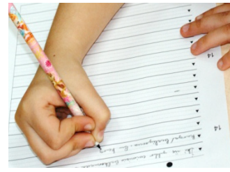
İki Parmak Baş ve Orta Parmak f= 26 (% 6.6)