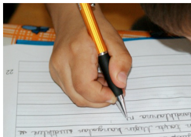
Kalem Üzerinde f= 322 (% 79.1)