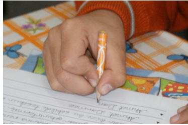
Şekil 1. En Sık Kullanılan Kalem Tutma Şekli

Amundson (1995), Koziatsek ve Powell (2003), Selin (2003) ve Tseng (1998)'e göre öğrenciler ve yetişkinler arasında en sık kullanılan kalem tutma şekli, kalemin baş ve işaret parmağı ile kavranması, orta parmakla da desteklenmesiyle oluşan şekildir.