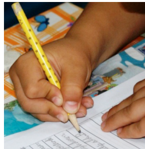
Üç Parmak f= 41 (% 10.1)