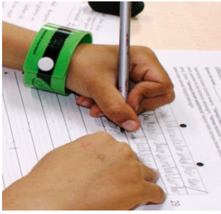
Alt Noktadan Kavrama f= 96 (% 23.6)