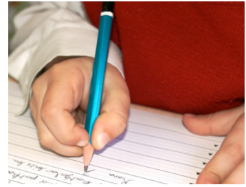
Orta Noktadan Kavrama f= 263 (% 64.6)