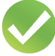
(Şekil 2a): DOAJ'a Kabul Edilmiş Dergi İşareti

Bu işaret, Mart 2014'te ilan edilen daha sıkı koşullar çerçevesinde yeniden başarılı bir başvuru yaparak DOAJ'da dizinlenmeye devam eden dergilere DOAJ tarafından verilir.