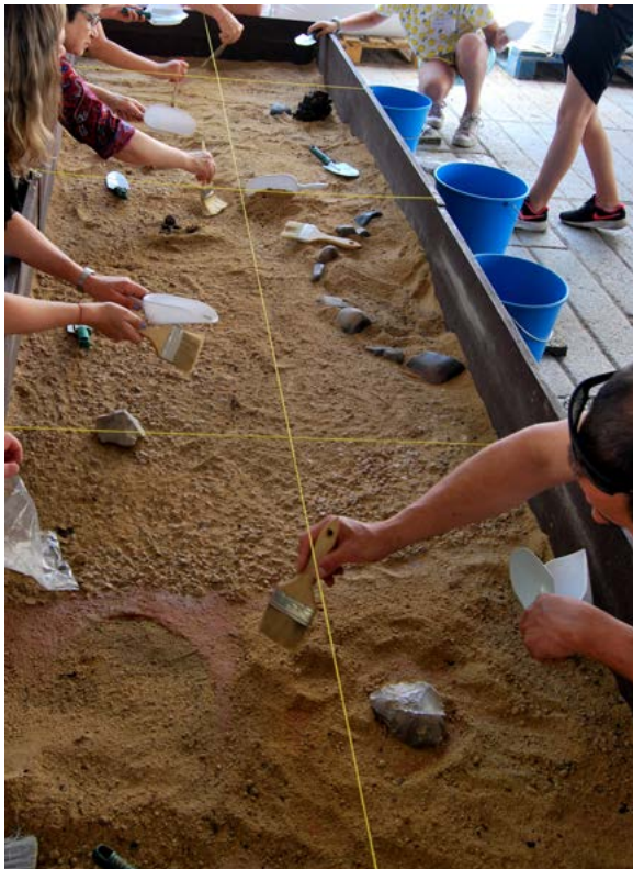
Fig. 2. Un momento de la excavación realizada en el taller Arqueólogo@s por un día . Los participantes excavan las estructuras prehistóricas que comienzan a hacerse visibles: dos agujeros de poste, el suelo de una cabaña y un hogar.

Dos talleres abordaron el estudio posterior de los materiales recuperados en la excavación subrayando el carácter multidisciplinar de la Arqueología. Viñas, trigos,