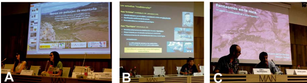
Fig. 8. La actividad Encuentros con investigadores agrupó distintas charlas cortas de los investigadores. Las imágenes recogen un momento de tres de ellas: “Iberos en paisajes de montaña” (A), “Algo más que joyas... Conceptos y herramientas en la investigación actual sobre orfebrería antigua” (B) y “Historias en el espacio, pisadas en el tiempo” (C) (Fotografías: A y C Óscar García Vuelta, B Juan Luis Pecharromán).