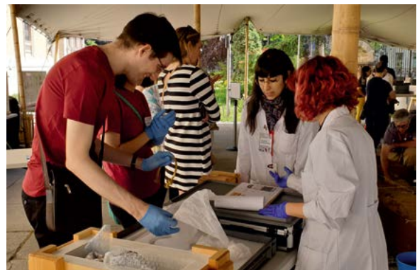
Fig. 5. Taller ¡Hola! Soy un objeto arqueológico, ¿me conservas? en el momento en que los asistentes desembalan un torques de oro (reproducción), como paso previo al proceso de catalogación.

El taller El laboratorio de las monedas (Dpto. de Numismática y Medallística) tuvo lugar en la cámara acorazada del Museo, de acceso restringido al público