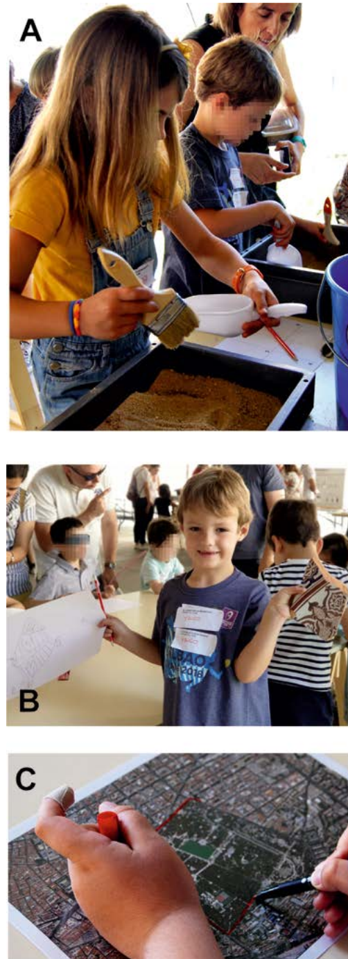
Fig. 1. Taller Arqueolog@s en construcción . A. Detalle de algunos participantes en la actividad “Tu primera excavación” (3-12 años) (Fotografía: Oscar García Vuelta). B. Un niño muestra el dibujo de la cerámica realizado en la actividad “El laboratorio de arqueología” (3-12 años) (Fotografía: María Ruíz del Árbol). C. Detalle del proceso de delimitación de los elementos del paisaje urbano identificados durante la actividad “La fotografía aérea” (7-12 años) (Fotografía: Oscar García Vuelta).