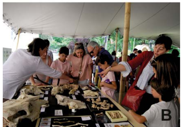
Fig. 3. El taller Viñas, trigos, vacas, ovejas y cerdos: Historia de la alimentación a través de la arqueobiología , aproximó a los participantes al estudio de una parte de los materiales orgánicos que se hallan en los yacimientos arqueológicos a través de los laboratorios de Arqueobotánica (A) y Arqueozoología (B).