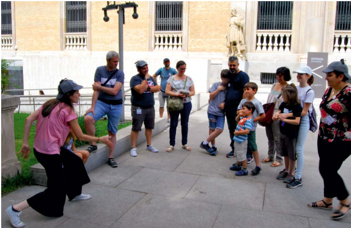
Fig. 4. Un momento del juego de pistas del taller Detectives del paisaje.

Conservación), a través de reproducciones, simuló el recorrido que efectúan los objetos arqueológicos desde que llegan al museo hasta que se ubican en sus salas de exposición o en sus almacenes, según convenga al discurso expositivo (Fig. 5). Como no todos llegan en óptimas condiciones se mostraron también a los asistentes las tareas que realiza el restaurador, diferenciándolas de las del conservador de museos.