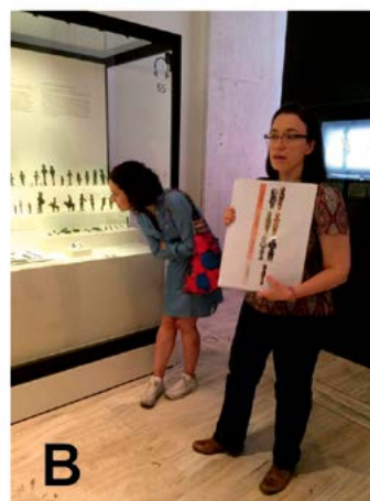
Fig. 7. En las salas de Protohistoria del MAN se realizaron tres recorridos especializados. A. Un momento del recorrido Seres que vuelan: fábulas y leyendas de hace 2500 años frente al monumento de Pozo Moro. B. El recorrido Uno de los nuestros. Cómo convertirse en un adulto entre los iberos junto a la vitrina de los exvotos ibéricos.