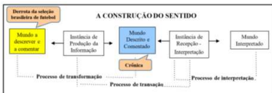
Figura 1: Mecânica da construção do sentido Adaptado de Charaudeau (2007, p.42)

Vejamos, esquematicamente, tal processo de construção de sentido: