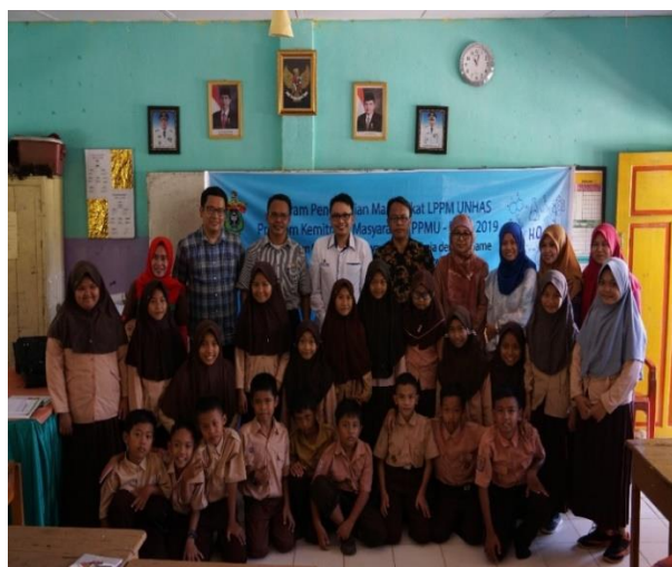
Gambar 5 Suasana Pelatihan aplikasi game edukasi interaktif