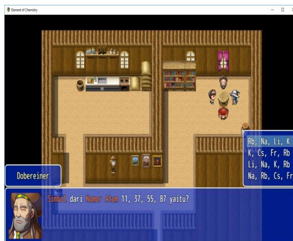
Gambar 2. Tampilan salah satu quiz dalam game