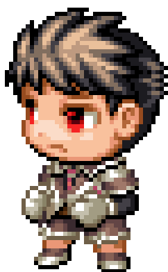
Henry (Karakter Hero)

Game edukasi ini juga dilengkapi dengan karakter Hero (Gambar 3) dan pasukan musuh dalam hal ini mewakili unsur-unsur kimia yang akan ditanyakan dalam quiz. Salah satu karakter musuh diperlihatkan pada Gambar 4.