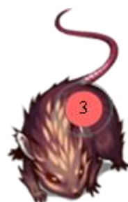
Litium (Pasukan Unsur, Golongan 1 (IA))