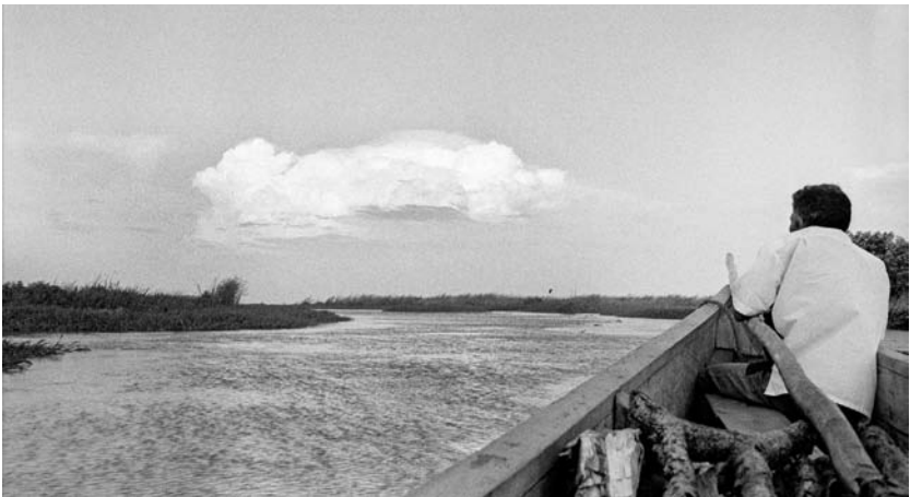
Por uno de los caños de la Ciénaga de Pajará.