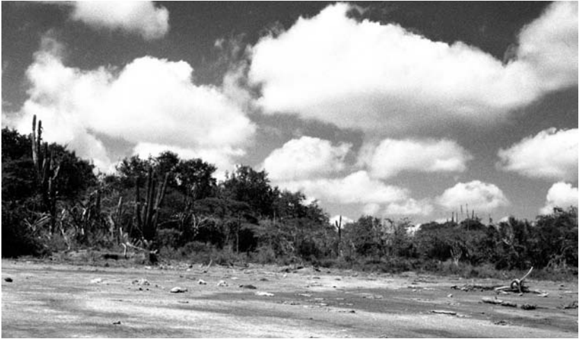
Playón de corralito, en los bordes de la ciénaga. Es aquí donde algunos habitantes de Nueva Venecia entierran a los infantes que no han sido bautizados.

6. Por falta de espacio no me refiero a los años de historia que nutren esta acumulación, pero es importante anotar que imaginarios de un exotismo tropical, nostalgia, deseos como la cacería, años de abandono estatal, la producción del pantano como manto para los secretos, degradación ambiental, el movimiento de bienes legales e ilegales, corrupción, etc., forman parte de esta historia, y se juntan en la masacre que ocurrió en noviembre de 2000.