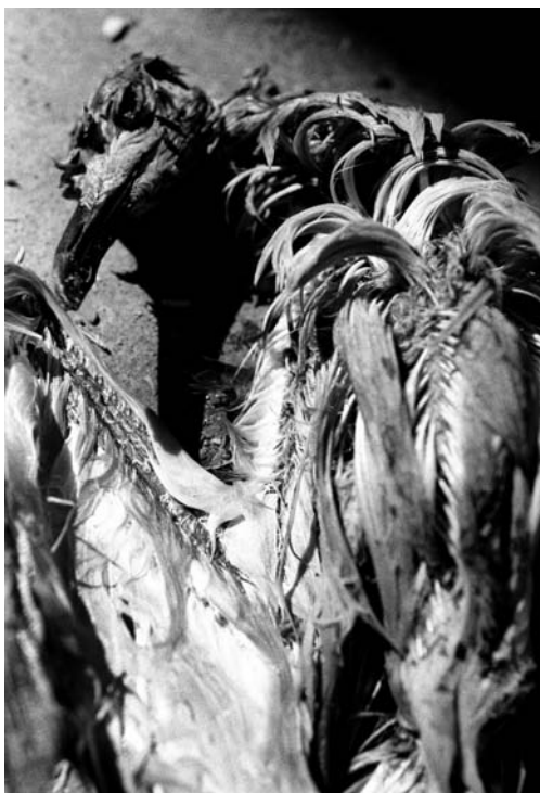
Ave de la ciénaga.