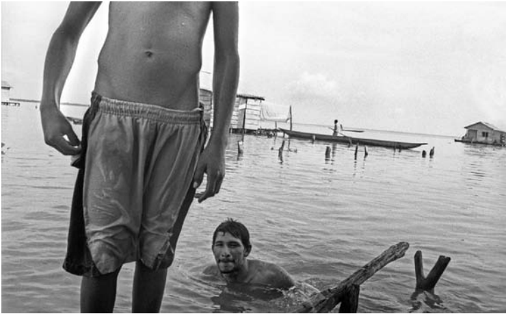
Baño después de una jornada de pesca.

Desde el mismo día de la masacre las personas han reocupado este espacio y han continuado con sus jornadas entre recuerdos, ocurrencias y nuevos sueños. Pero sobre todo, han continuado su vida sobre y, entre estas aguas, ocupado un espacio ya doblemente ocupado donde se acumulan los residuos del terror, donde entre la sustancia se forma una historia que se rehúsa al cierre.