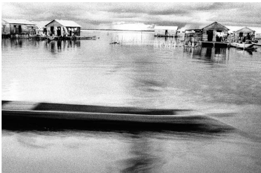
Sombra de una tarde de lluvia.

Muchas veces pregunté por el evento en sí, y en casi todas estas ocasiones la mirada de aquellos que lo vivieron se perdía en la inmensidad del horizonte, sobre el agua y bajo el calor sofocante. Era como si vieran algo que, sin duda, jamás podría ver. Muchas veces quise voltear mi propia mirada hacia estos lugares donde los fantasmas de la masacre parecen pasearse por la quietud del día a día, silenciosos y sin hacer escándalo. Ver en estas aguas los residuos del momento de terror es quizás un ejercicio de la imaginación. Pero es una tarea que implica la susceptibilidad a aquello que los relatos, los momentos y eventos de formas de memoria no convencionales dicen sobre la vida en