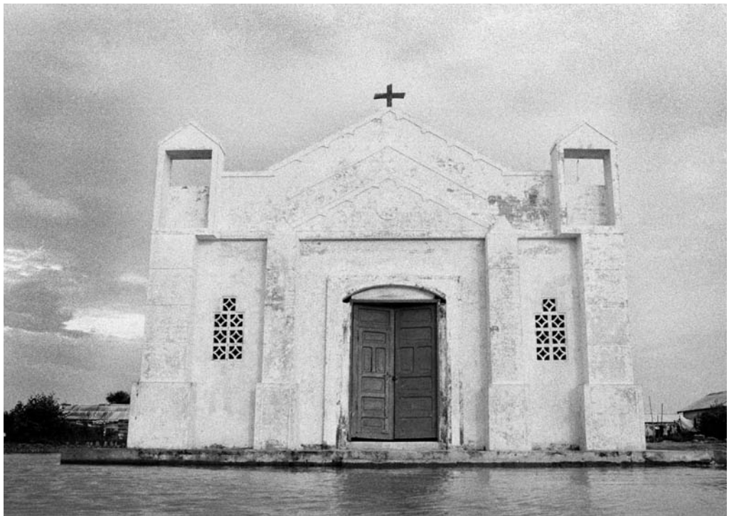
El patio de la iglesia de Nueva Venecia en creciente.

Cuando el cuerpo del hombre asesinado en una pelea de borrachos fue condenado por orden policial a permanecer en el patio de la iglesia para realizar el levantamiento antes de llevarlo al cementerio de Barranquilla, mientras los olores penetraban los cuerpos y las mentes, entre expresiones de angustia, rabia y llanto la gente repetía una y otra vez, “¡no, otra vez no!”, “¡no, otra vez!”. Esa mañana la fetidez de la descomposición se filtró sin pedir permiso entre quienes asistieron al levantamiento, rompiendo los límites del paso del tiempo para recrear un escenario de una memoria adormecida, más no ausente.