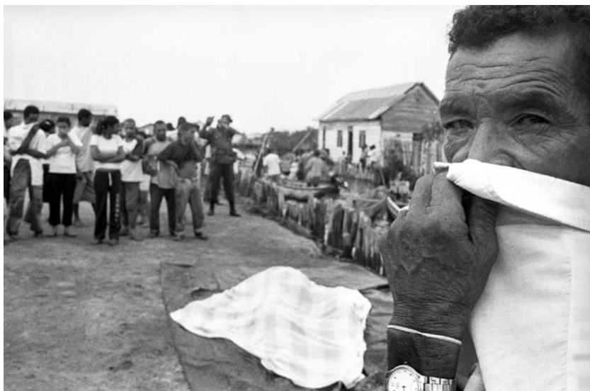
En patio de la iglesia, la tarde del levantamiento del cadáver de un hombre asesinado un Viernes Santo.