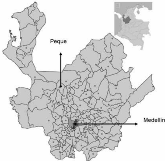
FIGURA 1. UBICACIÓN GEOGRÁFICA DEL MUNICIPIO DE PEQUE EN EL DEPARTAMENTO DE ANTIOQUIA