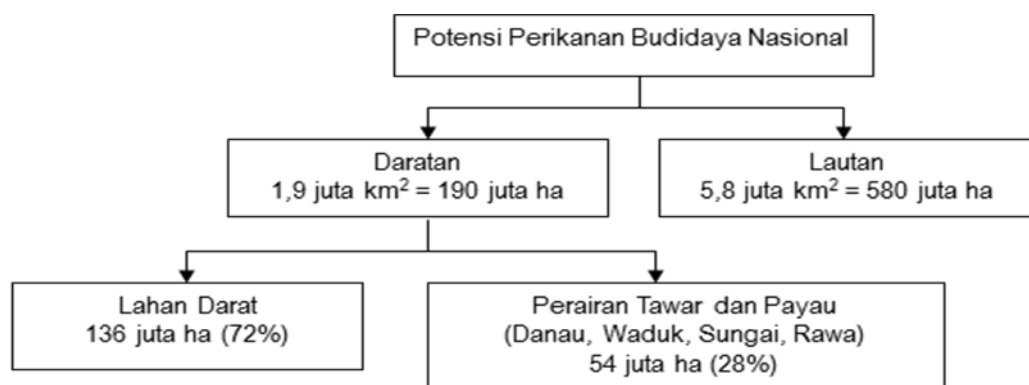
Gambar 1. Potensi sumber daya alam Indonesia untuk pengembangan akuakultur (Dahuri, 2017)

Indonesia memiliki daratan seluas 1,9 juta km 2 atau 25% dari luas total wilayah dan lautan 5,8 juta km 2 (75%), serta garis pantai sepanjang 98.181 km (keempat terpanjang di dunia setelah Kanada) dan lebih dari 13.466 pulau besar dan kecil (Gambar 1). Dari luas daratan tersebut, 54 juta ha (28%) adalah perairan tawar dan payau berupa danau, waduk, rawa, sungai, muara sungai. Luas perairan di lahan suboptimal Indonesia berupa perairan rawa diperkirakan mencapai 20,2 juta ha, yang terdiri dari rawa pasang surut seluas 11 juta ha dan lahan rawa lebak 9,2 juta (Mulyani dan Sarwani, 2013). Berdasarkan uraian di atas, Indonesia memiliki potensi pengembangan akuakultur yang besar dan menjadi pelaku utama akuakultur dunia, setidaknya setelah Cina, baik untuk budidaya air tawar, air payau apalagi marikultur. Potensi ekonomi marikultur Indonesia diperkirakan mencapai 210 milyar dolar AS per tahun sama dengan sektor energi dan sumber daya mineral, dan jauh di atas perikanan tangkap. Hampir belum ada informasi akurat mengenai potensi ekonomi perairan di lahan suboptimal Indonesia. Pengembangan akuakultur di perairan pada lahan subotimal berpeluang besar meningkatkan produksi akuakultur nasional. Indonesia merupakan produsen akuakultur terbesar ketiga dunia setelah Cina dan India, dengan pertumbuhan produksi paling tinggi yang pada periode 2010-2016 mencapai 19,13% dalam kurun waktu (Tabel 2).