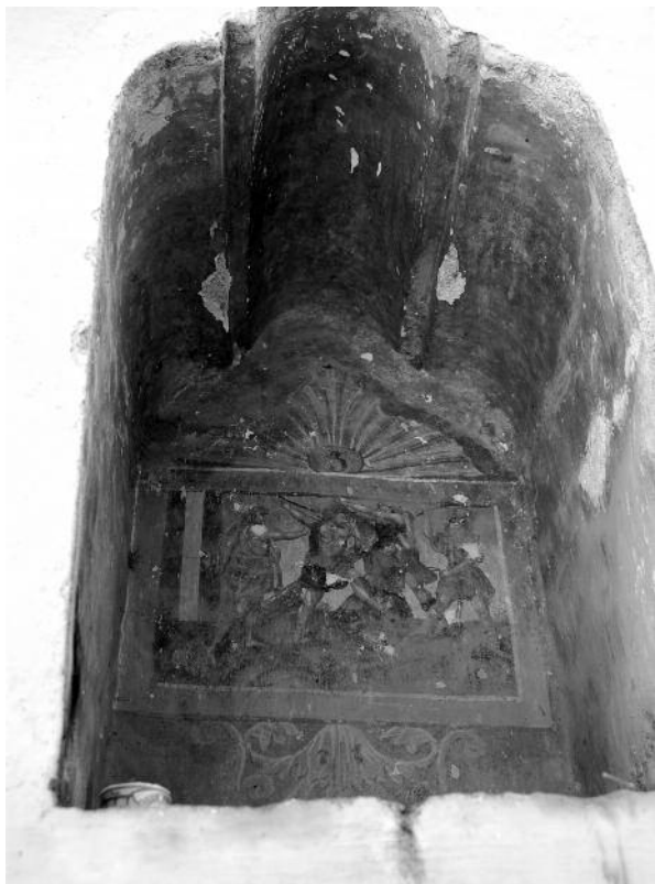
5. Anónimo, Tercera estación: Primera caída, siglo XVIII, Atrio del Santuario del Señor del Llanito, Dolores Hidalgo, Guanajuato.

tenidas en unos nichos [figs. 4 y 5] 7 . Quisiera sugerir que en El Llanito el ejercicio piadoso que se empezaba en el atrio se proseguía y se terminaba en el interior de la iglesia [fig. 6]. Efectivamente, en ambos lados de la nave del templo se encuentran grandes lienzos de temática pasionaria: la Última Cena, el Levantamiento de la Cruz, el Descendimiento de la Cruz y la entrega del Señor del Llanito a la localidad 8 . En este caso el ejercicio del Vía Crucis se realizaba nuevamente en el entorno de una imagen de culto: se empezaba en el atrio, con las diminutas pinturas murales, se seguía en la nave de la iglesia con los grandes lienzos, para terminar en la veneración al Señor del Llanito, una imagen de bulto [fig. 6]. Aquí, como en el ejemplo anteriormente mencionado de El Encino, también esta relación entre pintura y escultura se activa con la participación del devoto. Lo que nuevamente se desconoce es exactamente qué papel encargaba el crucifijo. ¿Fungía como una estación instituida del Vía Crucis o solamente como imagen de culto que se cruzaba al practicar el ejercicio devoto? También es importante subrayar que dos de los lienzos no corresponden a la temática tradicional del Vía Crucis: la Última Cena, y la entrega del Señor del Llanito a la localidad. Esta situación no es exclusiva de El Llanito, pero lo que es inhabitual es la inclusión de una temática local en el relato más genérico