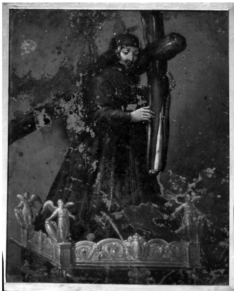
10. Juan Correa, Jesús Nazareno , siglos XVII-XVIII, Óleo sobre lámina de cobre, ca.26 x 32 cm. Seminario Conciliar de Zacatecas, Guadalupe.

La otra serie que formaría parte de este tipo de complementariedad, donde se entrelazan pinturas del Vía Crucis con retratos de imágenes de devoción, es una que se encuentra en la iglesia de San Francisco en la ciudad de San Miguel Allende 21 . Usualmente, la decimocuarta estación del Vía Crucis ilustra el Santo Sepulcro. La última estación de la serie del templo de San Francisco se sale de este modelo: no sólo representa a la Virgen de la Soledad pero es claramente el retrato de una escultura de bulto. La imagen se en-