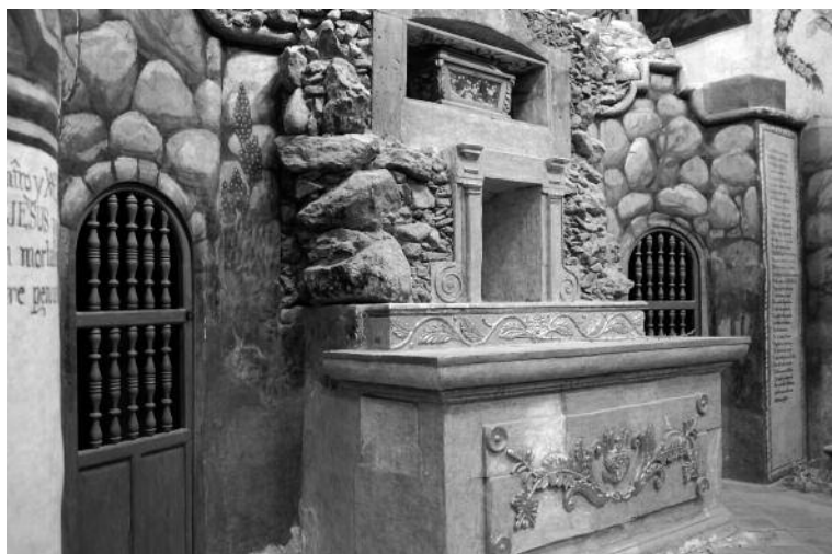
9. Capilla del Calvario, ca. 1780?, Santuario de Jesús Nazareno, Atotonilco, Guanajuato.