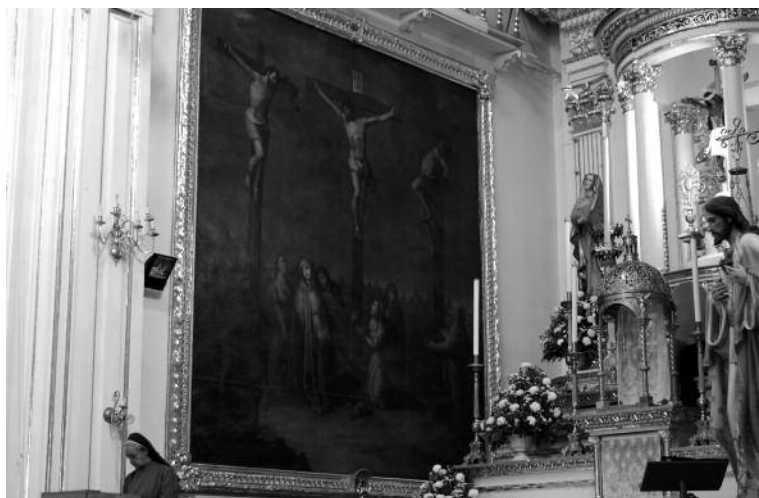
2. Andrés López, Muerte de Jesús, 1798, Iglesia del Encino, Aguascalientes.

El Vía Crucis narra, literalmente, al camino recorrido por Jesús con su Cruz camino al Calvario, desde su sentencia a muerte hasta el Santo Sepulcro. Las distintas escenas, conocidas como estaciones, están generalmente situadas en un espacio que permite su práctica procesional, a intervalos regulares alrededor de la nave de una iglesia, el claustro de un convento o en el atrio de una iglesia [figs. 1 y 4]. Se realiza el ejercicio al andar de una estación a la otra, recitando ciertas oraciones y meditaciones piadosas sobre los diversos acontecimientos de la Pasión. La finalidad de la devoción del Vía Crucis es ayudar al fiel a recrear en espíritu el peregrinaje a los lugares más importantes del sufrimiento y de la muerte de Cristo. Por esta razón el ejercicio piadoso forma parte de los peregrinajes de sustitución. Es decir, el fiel podía realizarlo en cualquier ámbito geográfico y ganarse las mismas indulgencias que si lo hubiera practicado en las calles de Jerusalén, evitando así las inquietudes y gastos de tan largo viaje 2 . El levantamiento y la práctica de las estaciones fueron comunes en el virreinato de Nueva España, desde principio del siglo XVII 3 .