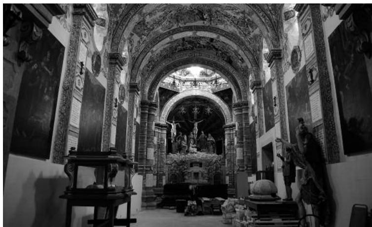
7. Vista general de la capilla del Calvario, ca. 1780, Santuario de Jesús Nazareno, Atotonilco, Guanajuato.