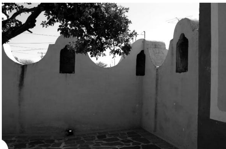
4. Anónimo, Vía Crucis, siglo XVIII, Atrio del Santuario del Señor del Llanito, Dolores Hidalgo, Guanajuato.