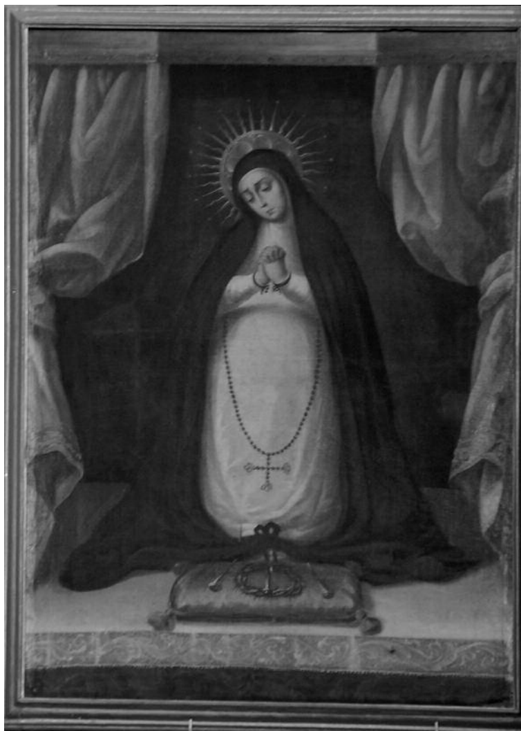
12. Barragán, Virgen de la Soledad , 195 x 110 cm, óleo sobre tela, siglo XVIII, San Francisco, San Miguel Allende, Guanajuato.

Como última consideración, quisiera aludir brevemente a la cuestión del paragón, este célebre debate que inició en Italia durante el Renacimiento, es decir la comparación, tal vez competición, para establecer qué expresión artística entre la pintura y la escultura, era el arte superior 24 . En el caso español, Xavier Bray argumentó recientemente que la diferencia entre ambos mundos se ha nublado en la producción artística del Siglo de Oro, pues tanto la pintura como la escultura policromada compartían un objetivo común: la representación realista de los temas sagrados para acercar el devoto al mundo divino y así tomaban prestado del lenguaje artístico peculiar del oponente. Si bien se desconocen por el momento casos novohispanos que hayan alimentado el debate, es legítimo pensar que los escultores novohispanos estuviesen al tanto de la situación europea. Y a falta de documentos escritos, las obras en sí pueden ser testimonios de