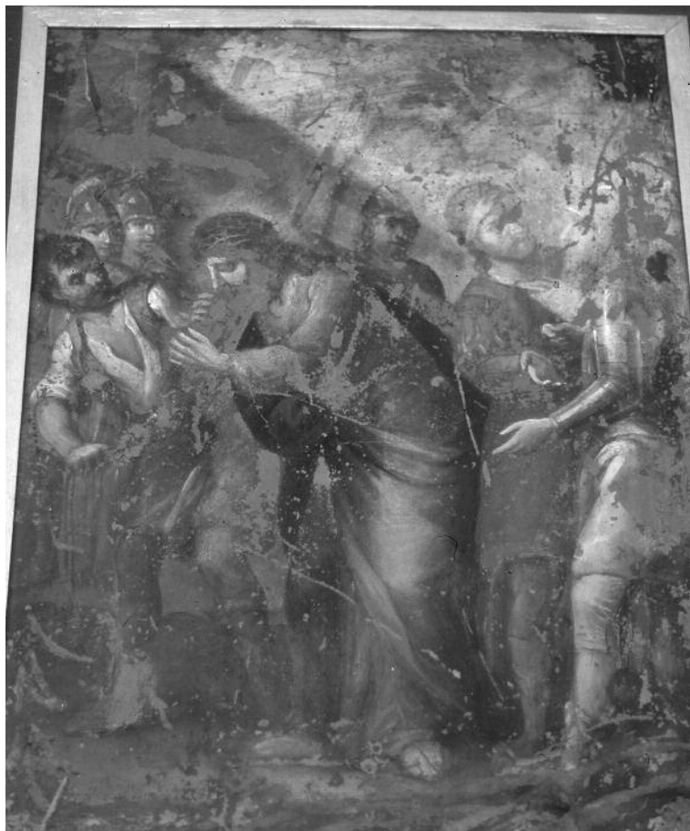
11. José de Alcívar, Jesús con la cruz auestas , siglo XVII-XVIII, Óleo sobre lámina de cobre, ca. 26 X 32 cm. Seminario Conciliar de Zacatecas, Guadalupe.

cuenta representada sobre la mesa del altar, con un par de cortinas abiertas para dejar ver la escultura [fig. 12] 22 . A sus pies, en una pequeña almohada están depositados la corona de espinas y los clavos de la crucifixión.