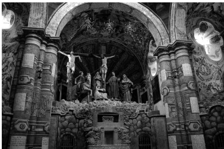
8. Anónimo, Grupo escultórico de la lanzada, Capilla del Calvario, ca. 1780?, Santuario de Jesús Nazareno, Atotonilco, Guanajuato.