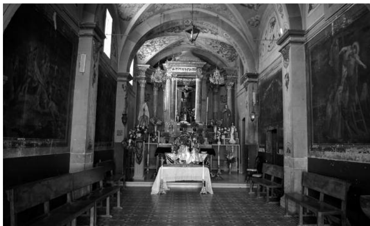
6. Vista general de la nave de la iglesia del Santuario del Señor del Llanito, Dolores Hidalgo, Guanajuato.

De cualquier manera, en el caso de la capilla del Calvario de Atotonilco, se trata de una complementariedad que va mucho más allá de la relación entre pintura y escultura, pues incluye los versos y la arquitectura, pero esta relación es nuevamente activada a través de la práctica del devoto.