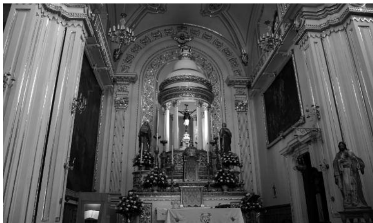
1. Vista del presbiterio con la duodécima y decimotercera estaciones a ambos lados, Iglesia del Encino, Aguascalientes. Vía Crucis de Andrés López, 1798.