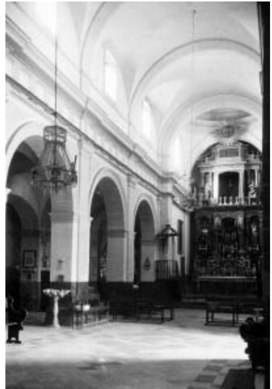
Figura 4.-Vista interior de la iglesia parroquial de El Coronil (Sevilla).

La estabilidad económica se hacía esperar y, por ello, Cabrera tuvo que tomar la iniciativa en sus trabajos, ofreciéndose a participar en el túmulo funerario con el que el Cabildo Catedral iba a honrar la muerte de Felipe II en 1598. Desgraciadamente para el capitán, será Martínez Montañés quien lleve a cabo tal empresa 57 . De todos modos, su nombre iba a estar relacionado con una de las tradiciones