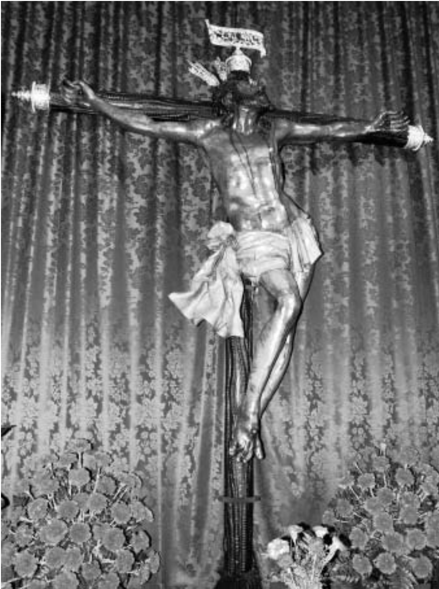
Figura 1. 1575. Marcos Cabrera. Crucificado de la Expiración. Capilla del Museo. Sevilla

anteriores que lo relacionan con Tierra Firme tales como la licencia de pasaje del 12 de abril de 1561 hacia la Isla de La Española. Se declara soltero, natural de Granada e hijo de Melchor de Cepeda y María de Ayala 6 . Del mismo modo, Mateo Sanz de Cepeda, Bernardo de Cepeda o el entallador Alonso de Cepeda son citados por López Martínez dentro de un grupo, en la actualidad más nutrido, donde aparece incluso un fraile agustino también apellidado Cepeda, el cual viaja en 1592 al Perú.