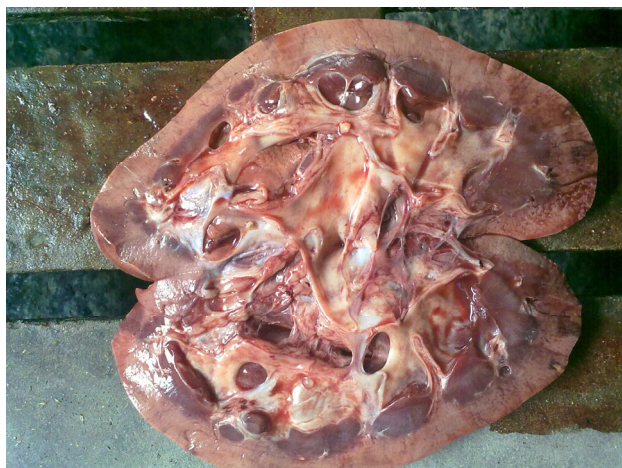
Рис. 3. Нирка за охратоксикозу. Гематоксилін та еозин x 400

Нирки у дослідних тварин були неоднорідно забарвлені у блідо-жовто-коричневий (рис. 3), а подекуди рожево-червоний колір. В окремих ділянках кіркової речовини нирки були строкаті внаслідок чергування ділянок блідо-жовтого кольору з ділянками червоно-сірого кольору. У трьох свиноматок в нирках знаходили дрібні кістозні порожнини. Волокниста капсула на деяких ділянках знімалась важко – унаслідок зрощення її з поверхнею нирок. У кірковому шарі подекуди знаходили дрібні вогнища (розміром 1–3 мм) сірого кольору. Консистенція нирок була ущільнена, особливо у ділянках сірого кольору, лише подекуди незначно в'яла. Ниркова миска та сечоводи були не-