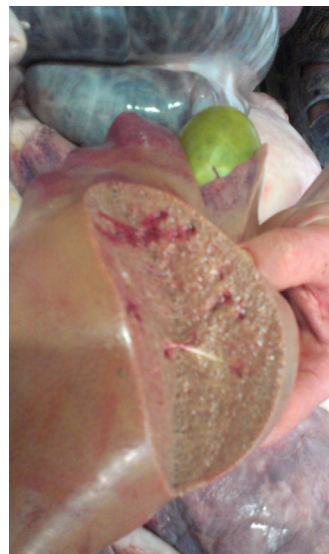
Рис. 2. Жирова дистрофія та гостра застійна гіперемія печінки. Розширення та переповнення жовчю жовчного міхура