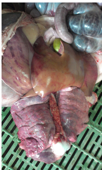
Рис. 1. Жирова дистрофія та гостра застійна гіперемія печінки

За гістологічного дослідження у гепатоцитах спостерігали розвиток альтеративних змін гепатоцитів (переважно жирової дистрофії та некротизів), а також помірних дисциркуляторних процесів (гострої венозної гіперемії та поодиноких діapedезних крововиливів). За гістологічного дослідження в цитоплазмі гепатоцитів виявляли вакуолі, в яких нагромаджувались нейтральні жири.