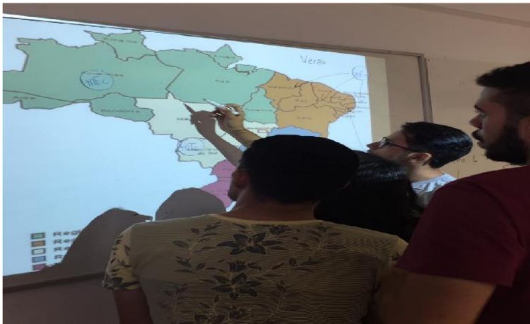
Figura 6 - Jogo das Massas de Ar.

Os estudantes apresentaram bastante interesse no jogo, pois até então ainda não tinham visto esse conteúdo e a metodologia abordada foi uma coisa nova para eles, então além deles conseguirem entender esse assunto, eles estavam aprendendo de uma maneira mais interessante e lúdica, de uma forma que eles realmente aprenderam, e não somente decorem o conteúdo apresentado em questão, salvo que, além disso, a aplicação desta atividade com a metodologia lúdica pode ser uma futura ferramenta para eles utilizarem em sala de aula, como futuros professores.