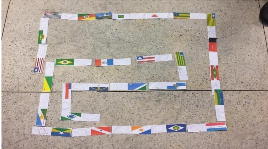
Figura 4 - Resultado do Dominó.

O jogo da memória proporcionou uma interação bem interessante, visto que, nem todos se conheciam, e isso fez com que o grupo desenvolvesse diálogos gerando uma maior interação e conhecimento entre eles, a realização da referida atividade fez com que os alunos descobrissem curiosidades sobre os países, além de desenvolver a criticidade deles, pois sempre surgia a pergunta do por que da existência da tal curiosidade em um determinado país.