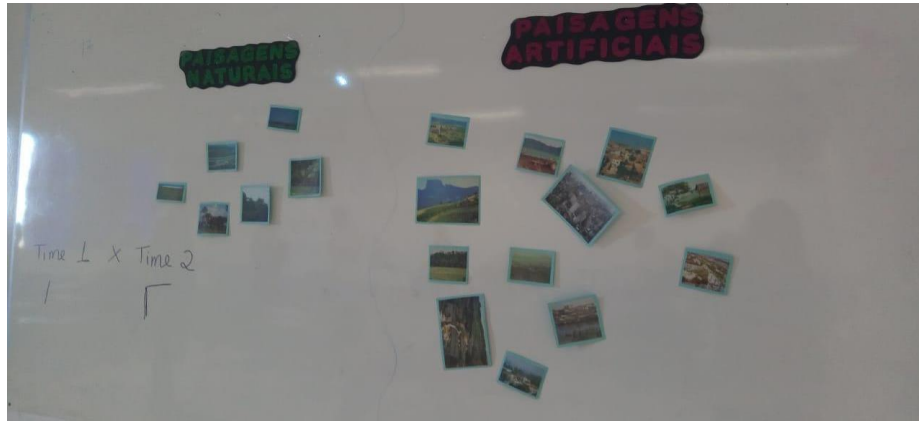
Figura 2 - Jogo das Paisagens.

de todos os participantes, outro ponto importante foi o tempo máximo estabelecido entre pegar as imagens até colocar na lousa, onde eles tinham um minuto para isso, fazendo com que eles tivessem que correr e se comunicar com os membros da equipe, tendo em vista que ao final do jogo já era visível um clima mais descontraído por parte dos alunos da imagem (Figura 2).