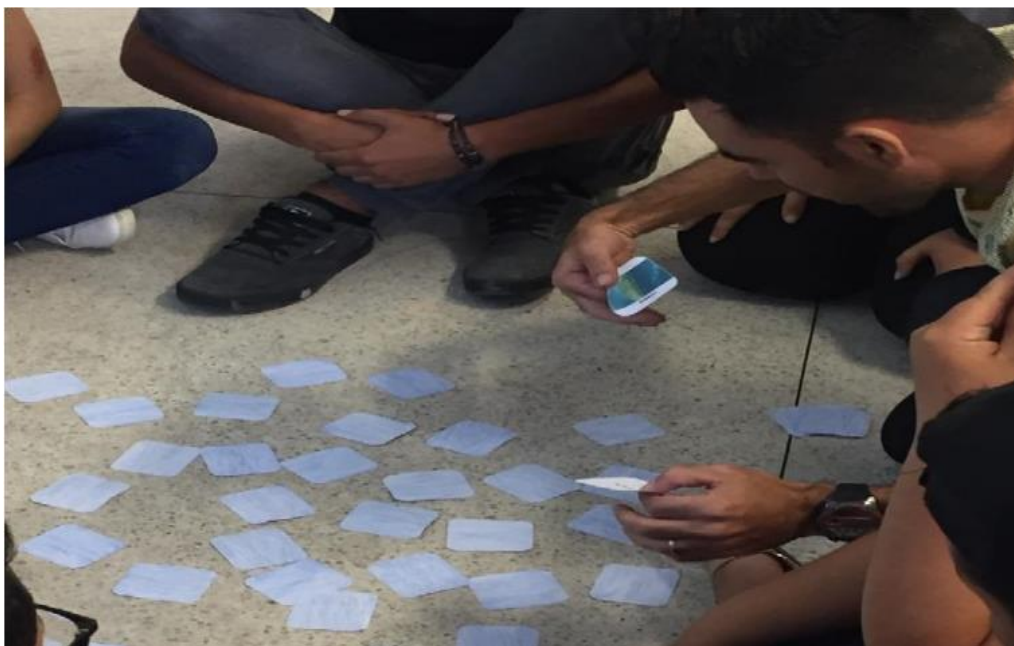
Figura 5 - Jogo da Memória.

O software Google Earth Pro foi apresentado aos alunos, tendo em vista que eles não tinham o conhecimento dessa ferramenta com um possível aliado ao ensino da Geografia. A aplicação desse sistema de informação geográfica (SIG) na atividade se deu por conta das imagens de satélites que foram retiradas a partir dele (Figura 5).