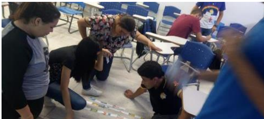
Figura 3 - Dominó

Durante a aplicação do jogo foi visível uma certa dificuldade no conteúdo que apresentava a temática dos estados e suas divisões político-administrativas, cujo os alunos demoram cerca de 40 minutos para completar toda atividade, a princípio os alunos alegaram uma grande dificuldade em identificar as bandeiras dos estados e as suas delimitações territoriais, já na outra temática o desenrolar do mesmo foi bem fluido já que apresentava apenas conceitos sobre domínios morfoclimáticos e geomorfológicos, os alunos presentes tinha uma certa aproximação com o conteúdo abordado em questão (Figura 3 e 4).