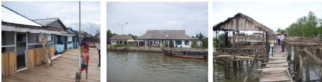
Gambar 1 Dermaga dan Kondisi Sekitarnya di Sungai Mesuji

Kondisi Dermaga Sungai Sidang tidak jauh berbeda dengan Dermaga Wiralaga, yaitu rusak berat dan tidak berfungsi. Namun kegiatan masyarakat di sini tetap menggunakan angkutan sungai dengan menggunakan perahu klotok milik pribadi. Hampir seluruh rumah yang ada di tepi Sungai Mesuji memiliki perahu dan dermaganya pun dibuat oleh masyarakat secara swadaya. Masyarakat menggunakan perahu klotok untuk menuju Rawajitu Utara, namun tidak dengan jadwal tetap. Angkutan sungai yang masih mempunyai jalur pelayaran adalah Kecamatan Mesuji Timur-Kecamatan Rawajitu Utara, dengan menggunakan kapal motor berukuran kurang dari 20 GT dan speedboat . Keberadaan beberapa perusahaan perkebunan, seperti perkebunan sawit, karet, singkong (bahan tepung tapioka), dan tambak atau perikanan di sekitar Sungai Mesuji merupakan potensi dalam mempertimbangkan revitalisasi transportasi sungai di wilayah ini.