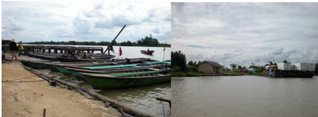
Gambar 3 Dermaga Cabang (kiri) dan Dermaga Antasena (kanan)

Dermaga Antasena berada di Kabupaten Tulang Bawang dan merupakan dermaga yang dilalui oleh rute dari Dermaga Cabang dan Dermaga Sadewa. Kondisi Dermaga Antasena masih berupa lahan kosong, sehingga kebanyakan penyeberangan masih menggunakan dermaga milik perusahaan PT Central Pertiwi Bali (PT CPB).