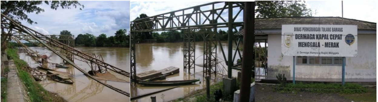
Gambar 2 Dermaga Menggala di Sungai Tulang Bawang

Keberadaan beberapa perusahaan perkebunan, tambak, atau perikanan menimbulkan adanya potensi untuk revitalisasi transportasi sungai, khususnya untuk transportasi barang. Untuk mendukung hal ini diperlukan identifikasi karakteristik kapal yang diperlukan agar dapat beradaptasi dengan kondisi sungai.