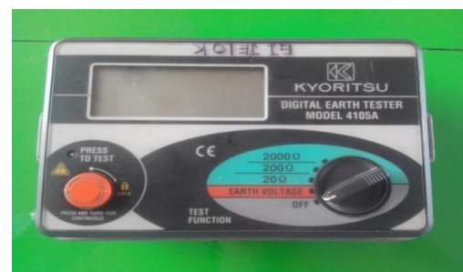
Gambar 2. Alat Ukur Earth Tester

Gambar 2 menunjukkan alat pengukuran tahanan pentanahan menara ini memakai alat yang dinamakan Earth Tester dengan nama alat Kyoritsu, digital earth tester model 4105A. Perancangan alat ukur tahanan tanah digital ini menggunakan tiga batang elektroda yang di tanamkan yaitu elektroda E (earth), elektroda P (potensial), dan elektroda C (current) tujuan penggunaan tiga batang elektroda ini yaitu untuk mengetahui sejauh mana tahanan dapat mengalirkan arus listrik. Alat ukur ini juga mempunyai intruksi penggunaannya yaitu dari pengecekan baterai, pemasangan jarak antara elektroda E, P, dan C yaitu 5 sampai 10 meter dengan sudut 180^\circ dan pengukuran tegangan bumi atau dapat di sebut earth voltage tidak boleh melebihi 10 volt, jika tegangan bumi melebihi 10 volt hal ini dapat mengakibatkan kesalahan yang berlebih dalam pengukuran resistansi pentanahan. Akurasi dari alat ini \pm 2 \% dari pengukuran.