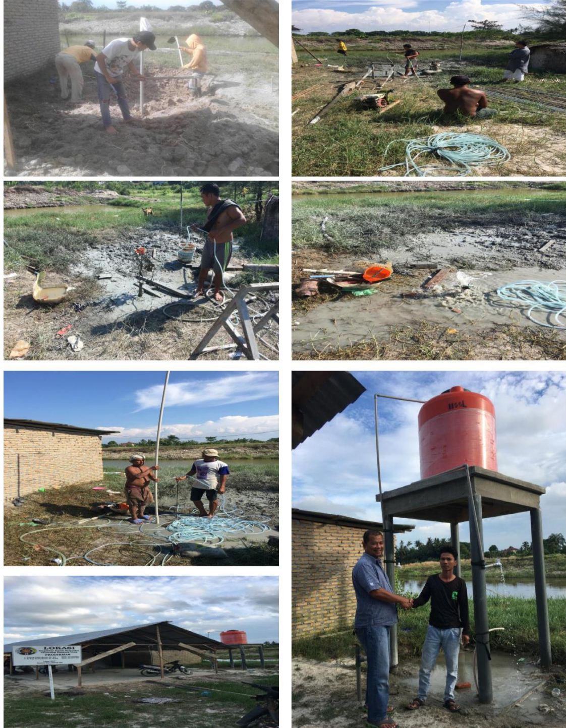
Gambar 2.2. Dokumentasi kegiatan pembuatan fasilitas air bersih

Proses pembuatan instalasi fasilitas air bersih untuk masyarakat nelayan di Dusun II Desa bagan Kuala Kecamatan Tanjung Beringin Kabupaten Serdang Bedagai dapat dilihat pada Gambar 2.2.