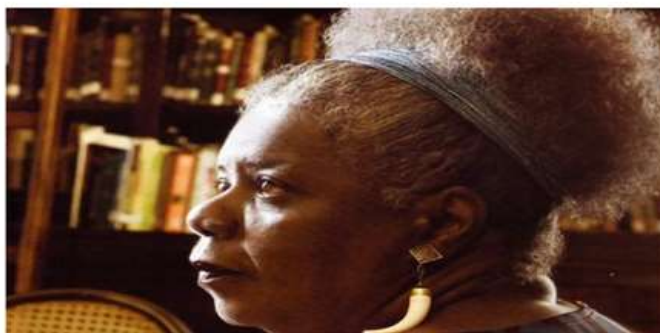
A escritora mineira Conceição Evaristo, que pode ser escolhida para a ABL.

Se a escolha ocorrer, será a primeira vez em 120 anos que a ABL terá uma escritora negra como membra.