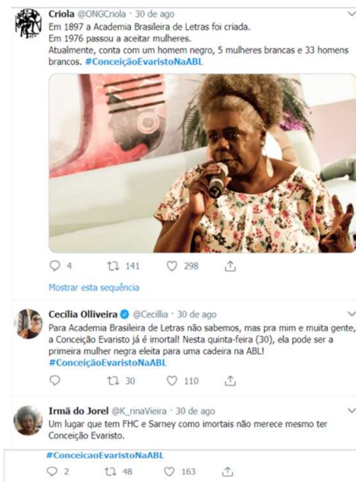
Figura 6: #ConceiçãoEvaristoNaABL [Twitter] Disponível em: https://mobile.twitter.com/hashtag/Concei%C3%A7%C3%A3oEvaristoNaABL Acesso em: 25/10/2018

Logo, o enunciatário, em sua autonomia, conduz a sua leitura e se faz ser um internauta-cidadão, pois, para Pierre Lévy, os internautas quando possuem acesso às informações de qualidade podem revelar cidadãos mais conscientes, mais bem informados e mais ativos politicamente (FERRARI, 2012). Difere, então, do internauta que se concentra apenas no site , não expandindo, não se dispersando ao clicar nos links , visto que, ao fazermos o contrário, permitimos encontrar as comunidades marginalizadas, as multidões, os grupos congruentes e divergentes, por meio das redes sociais vigentes deste século.