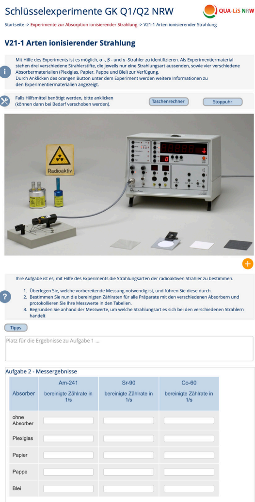
Abb. 3: Beispiel für ein interaktives Arbeitsblatt mit IBE für die unterrichtliche Erprobung in der Pilotphase.

Ein Beispiel für die in der Pilotphase (s. u.) von den Autor*innen entwickelten digitalen Lernmaterialien mit IBE ist ein interaktives Arbeitsblatt zur Untersuchung radioaktiver Strahlung (Abb. 3). Hier wurden lehrplankonforme Aufgaben entwickelt, in denen das IBE Handlungen und Beobachtungen ermöglicht, die dem realen Experiment weitestgehend entsprechen. So lässt sich der verwendete Digitalzähler entsprechend bedienen, wobei die für die Bearbeitung der Aufgaben nicht erforderlichen Funktionen des Gerätes nicht aktiv sind. Weiter bietet das Arbeitsblatt Hilfsmittel wie Taschenrechner und Stoppuhr sowie Möglichkeiten für die Protokollierung der Messwerte und die Formulierung