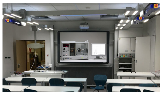
Abb. 4: Beispiel für die Nutzung eines IBE am digitalen Whiteboard in einem modern ausgestatteten Fachraum. Das abgebildete Röntgengerät ist in Anlehnung an das reale Gerät bedienbar (Ebene der Substitution) und ermöglicht die Durchführung verschiedener Experimente mit Röntgenstrahlung (Röntgenbilder, Bragg-Reflexion, Bestimmen der planckschen Konstante, Einfluss des Anodenmaterials).

Die IBE sind natürlich immer auch unabhängig von den hier beispielhaft entwickelten Lernmaterialien einsetzbar. So besteht bereits für die Ebene der Substitution die Möglichkeit, das IBE etwa über ein interaktives Whiteboard zentral (Abb. 4) oder auch individuell mit Laptops oder Tablets in eine Lernumgebung vielfältig zu integrieren. Über die Exportfunktion in tet.folio wäre auch eine Offline-Nutzung der IBE möglich. Begleitende Arbeitsmaterialien könnten zunächst traditionell auf Papier bereitgestellt werden, in späteren Ebenen / Stufen dann auch digital.