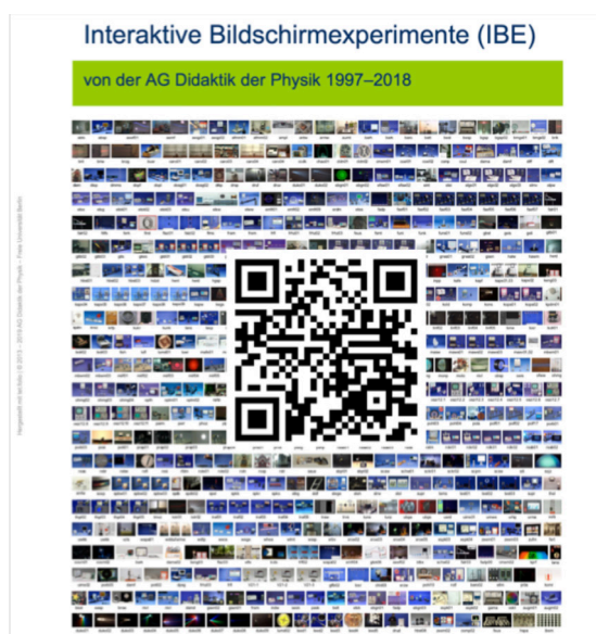
Abb. 5: Titelseite des offenen IBE-Portals über das neben den hier neu entwickelten IBE zu den Schlüsselexperimenten auch der Altbestand erschlossen werden wird.

Das offene IBE-Portal (Abb. 5) dient in erster Linie der flexiblen Erweiterung und Individualisierung realen Experimentierens (Stufe des Enhancement mit den Ebenen Substitution und Augmentation; [2]). Es bietet später dann Bausteine für die Herstellung und Bereitstellung eigener (neuartiger) Lernmaterialien (Stufe der Transformation mit den Ebenen Modification und Redefinition; ebd.) über die Plattform tet.folio.