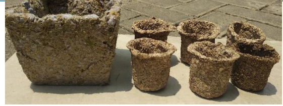
Gambar 5. Hasil Biodegradable pot

Pembuatan biodegradable pot yang berasal dari jerami padi dan sampah kertas dengan perbandingan 1:1 serta penambahan tepung tapioka yang berfungsi sebagai perekat yang berasal dari bahan alami dapat menghasilkan produk yang cukup kompetitif, dengan adanya perlakuan finishing saat pot sudah kering dengan pelapisan vernis dibagian luar pot dan pewarnaan pada pot membuat produk yang dihasilkan menjadi lebih menarik.