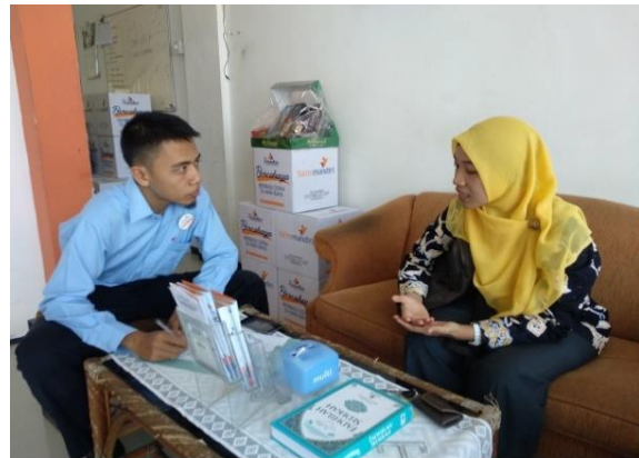
Gambar 1. Pertemuan dan diskusi dengan mitra.

Berdasarkan hasil diskusi antara tim pengusul bersama mitra, diperoleh solusi untuk mengatasi permasalahan yang ada berupa sosialisasi, pelatihan pembuatan biodegradable pot berbahan dasar kertas dan jerami serta metode pemasarannya, dan evaluasi kegiatan. Kegiatan pengabdian akan dilakukan dengan memberikan pemahaman terhadap mitra tentang pentingnya pengelolaan sampah, pengetahuan tentang kandungan dan jenis-jenis kertas dan jerami, proses pembuatan biodegradable pot , manajemen pemasaran produk yang dihasilkan dan evaluasi. Solusi permasalahan yang telah disepakati bersama tersebut dapat digambarkan sebagai berikut.