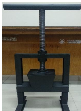
Gambar 4. Mesin Cetak Biodegradable pot

Mesin Press biodegradable pot dipakai untuk mencetak pot serta memeras atau menghilangkan kadar air pada adonan. Secara umum alat dibuat dari logam yang terdiri dari 2 bagian balok pencetak pot dengan menggunakan system bongkar pasang cetakan, badan mesin untuk tempat cetakan dan balok ulir digunakan untuk mengepres dan mengeluarkan kadar air pada adonan.