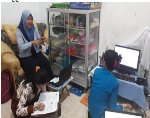
Gambar 5. Pendampingan Manajemen Usaha