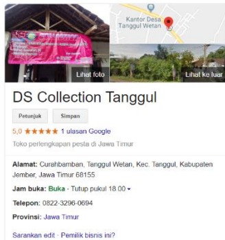
Gambar 4. Pendampingan Pembuatan Sosial Media