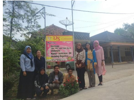
Gambar 7. Monitoring Akhir