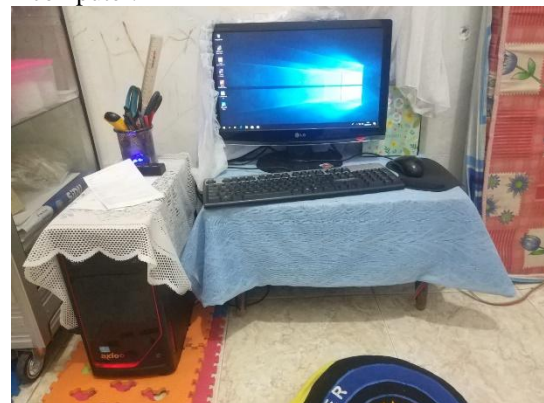
Gambar 2. Perangkat Komputer