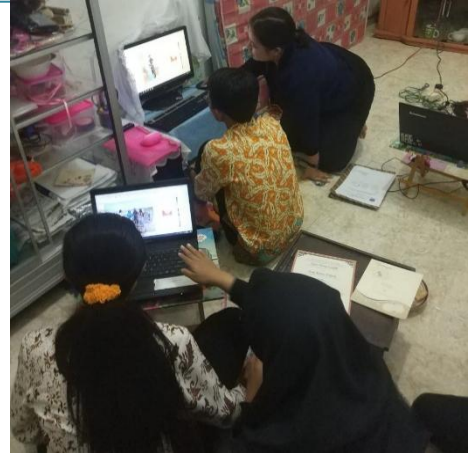
Gambar 6. Pendampingan Penggunaan Alat