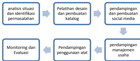
Gambar 1. Metode Pelaksanaan

Kegiatan pengabdian ini akan dilaksanakan dalam beberapa tahapan sebagai solusi yang ditawarkan. Berikut ini adalah metode pelaksanaan pada Gambar 1: