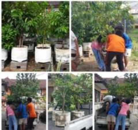
Gambar 2. Pemasaran tabulampot

Pelaksanaan program IBIKK Bibit Buah-buahan Langka Bali didukung oleh sumberdaya manusia (SDM) yang memiliki latar belakang pendidikan dan pengalaman relevan dengan usaha yang dikembangkan.