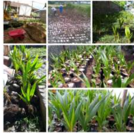
Gambar 3. Pembibitan Kelapa gading

Pertanian Unipas seperti tersaji pada gambar 3.