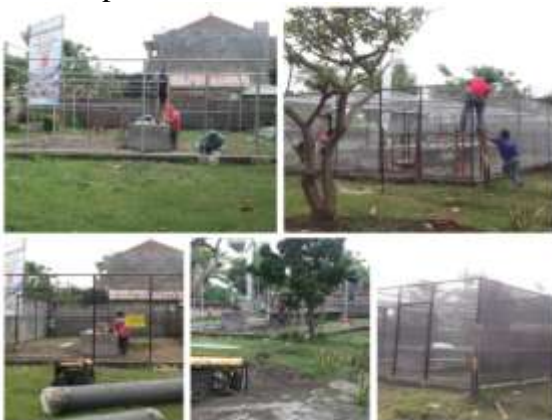
Gambar 4. Pembuatan rumah agronet

Sebagian besar program dan kegiatan yang direncanakan pada tahun 2016 telah dan sedang dalam proses realisasi. Pembuatan bibit, tabulampot dan kegiatan pengelolaan usaha lainnya dilakukan secara kontinu. Dalam perjalanan pengelolaan usaha, tantangan utama yang dihadapi adalah sulitnya mendapatkan bahan tanam (benih/bibit) buah-buahan langka Bali, dan pemasaran produk juga cukup sulit karena belum banyak masyarakat mengenal manfaat buah-buahan tersebut. Dengan dukungan berbagai pihak, terutama Pemerintah Provinsi Bali dengan diberlakukannya Perda tentang Buah-buahan Lokal dan juga dukungan Pemerintah Kabupaten Buleleng melalui kebijakan pengembangan buah-buahan unggulan lokal Buleleng, terutama yang sudah cukup langka seperti mangga Amplemsari dan Durian Bestala, maka secara perlahan usaha bibit buah-buahan langka Bali mulai berkembang sesuai harapan (Perda Bali No. 16, 2009).