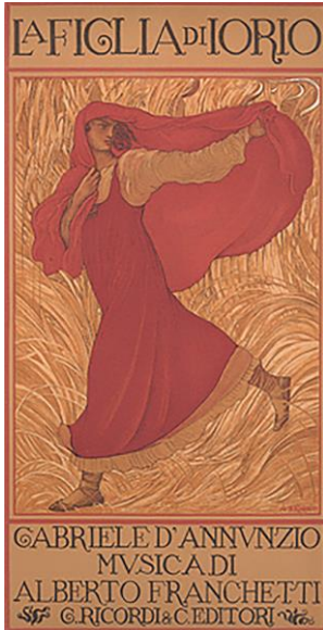
Fig. 7. Adolfo de Carolis, Manifesto per la prima rappresentazione dell'opera di Alberto Franchetti su libretto di Gabriele D'Annunzio (Milano, Teatro alla Scala, 29 marzo 1906).