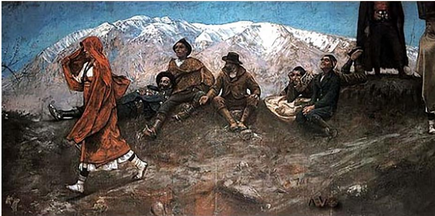
Fig. 6. Francesco Paolo Michetti, La figlia di Iorio , Pescara, Palazzo della Provincia.

Giungendo finalmente a La figlia di Iorio , (fig. 6)