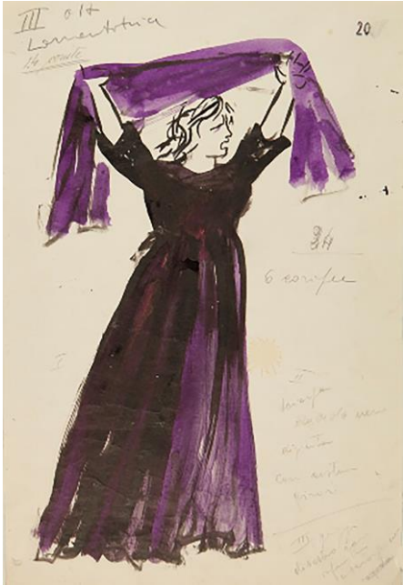
Fig. 11. Renato Guttuso, Figurino di una Lamentatrice per la rappresentazione milanese dell'opera La figlia di Iorio di Ildebrando Pizzetti (Milano, Teatro alla Scala, 24 marzo 1956). Milano - Archivio Storico "Teatro alla Scala".