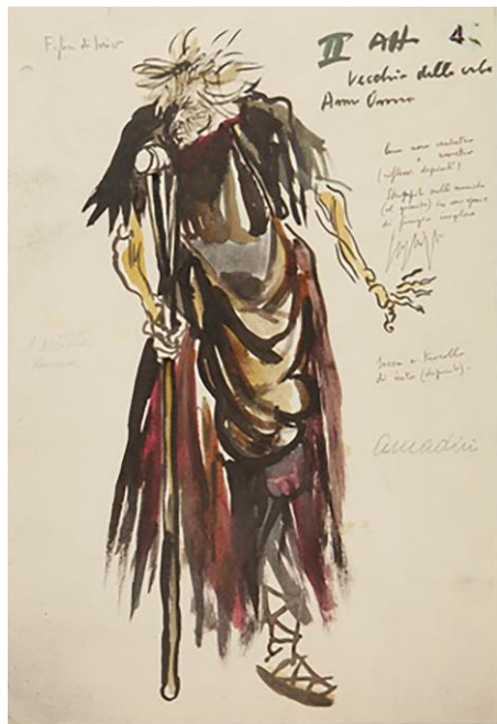
Fig. 13. Renato Guttuso, Figurino della Vecchia dell’Erbe per la rappresentazione milanese dell’opera La figlia di Iorio di Ildebrando Pizzetti (Milano, Teatro alla Scala, 24 marzo 1956).

abruzzesi, Finamore e De Nino 31 –, il Canto dei pellegrini “Evviva Maria” – un antico canto processionario delle genti d’Abruzzo che si ripete nella I e V scena del II atto 32 – e il Coro delle lamentatrici (I scena III atto) che Silvio D’Amico nella sua recensione su «La Tribuna» (13 ottobre 1934) giudicò “bellissimo”.