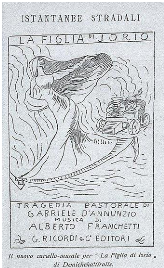
Fig. 10. Vignetta satirica apparsa su «Ars et Labor. Musica e musicisti. Rivista mensile illustrata», A. 61 - vol. 1, 15 maggio 1906, p. 447.

Presa in blocco, la musica di Alberto Franchetti imbruttisce inequivocabilmente la Figlia di Iorio e ne fa un assai brutto melodrammatico. [...] questa musica, faciletta e banaletta anzichè, ma che viene presentata pomposamente paludata con un'orchestrazione tronfia e con una armonia che vuol essere sapiente ed elegante, [...] sa di scuola lontano un chilometro. [...] i temi sono buttati là, intermessi tra le melodie che talvolta rasentano la canzonetta. Vedasi per esempio quella di Ornella sulle parole: Tutta di verde mi voglio vestire , [...] dove il musicista per l'equivoco del canto popolare scade in una faciloneria non mai abbastanza deprecabile 23 .