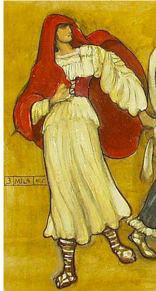
Fig. 8. Adolfo De Carolis, Figurino di Mila per la prima rappresentazione dell'opera di Alberto Franchetti su libretto di Gabriele D'Annunzio (Milano, Teatro alla Scala, 29 marzo 1906).