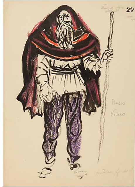
Fig. 12. Renato Guttuso, Figurino di Iona di Midia per la rappresentazione milanese dell'opera La figlia di Iorio di Ildebrando Pizzetti (Milano, Teatro alla Scala, 24 marzo 1956). Milano - Archivio Storico "Teatro alla Scala".

Probabilmente per l'esperienza passata e per la riconosciuta valentia compositiva nell'ambito della musica popolare – per inciso, Albanese nel 1927 pubblica una raccolta di venti canzoni abruzzesi, Nuovi Canti Popolari d'Abruzzo che dedica a Gabriele D'Annunzio "Mastre cantore di sta Terra nostre" 29 –, nel '34, appunto, lo vediamo affiancato a Renzo Massarani nella composizione delle musiche di scena per l'allestimento de La Figlia di Iorio sotto la regia di Luigi Pirandello coadiuvato da Guido Salvini, e la scenografia e i costumi disegnati da Giorgio De Chirico 30 . (fig. 14) Il manoscritto autografo, rintracciato presso gli archivi della Fondazione Ugo e Olga Levi di Venezia, testimonia i numeri musicali che vennero curati da Albanese: le briose e ingenue canzoni intonate da Ornella nella I scena del I atto Tutta di verde... e Tonta e pitonta – ambedue suggerite a D'Annunzio dagli studi e dalle novelle dei maggiori studiosi di tradizioni