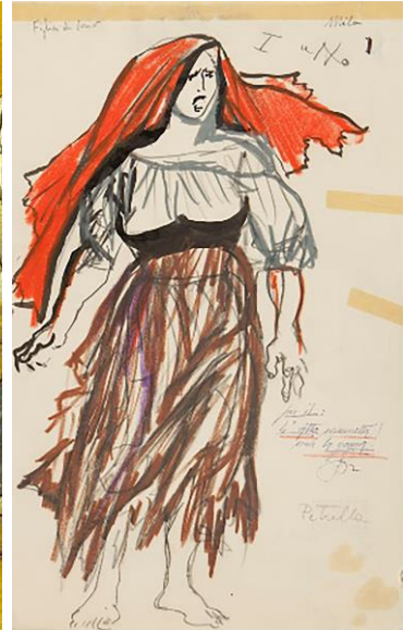
Fig. 9. Renato Guttuso, Figurino di Mila per la rappresentazione milanese dell'opera La figlia di Iorio di Ildebrando Pizzetti (Milano, Teatro alla Scala, 24 marzo 1956). Milano - Archivio Storico "Teatro alla Scala".

Uno dei tanti aspetti che ha caratterizzato l'esperienza musicale del XX secolo è, come sappiamo, quello relativo al folklorismo che, nel caso della Figlia di Iorio , ha causato il riproporsi nel tempo di rivestimenti musicali diversamente in relazione con la dimensione esotica di questa tragedia traboccante di colori, ritmo, luce e canto popolari. Uno studioso di questi aspetti della versificazione dannunziana – Ottaviano Giannangeli –, ha analizzato La figlia di Iorio cercando di comparare le strategie del Vate con le diverse modalità di sfruttamento degli stilemi popolari che Béla Bartók, nella sua riflessione sull' Influenza della musica contadina sulla musica colta moderna , ha a suo tempo individuato: