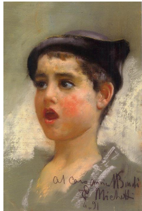
Fig. 2. Francesco Paolo Michetti, Ragazzo che canta, Giulianova, Pinacoteca Civica "V. Bindi".