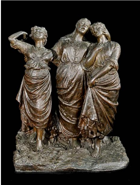
Fig. 4. Costantino Barbella, Canto d'amore, collezione privata.

Sono immagini ispirate da ricordi personali e naturali impressioni che i componenti del Cenacolo condividono e che corrono e ricorrono nelle pagine e nelle riproduzioni di un'intera generazione e oltre. Da Costantino Barbella a Pasquale Celommi (figg. 4-5)