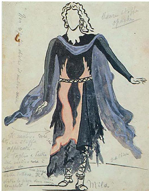
Fig. 14. Giorgio De Chirico, Figurino di Mila per la messa in scena de La figlia di Iorio a Roma, Teatro Argentina, 10 ottobre 1934.

Premesso che tutti questi interventi musicali necessitano di uno studio approfondito e di una comparazione con la tradizione folcloristica locale – il manoscritto veneziano non è citato in alcuna delle fonti che riguardano il maestro Albanese o le messe in scena della Figlia di Iorio –, ci sembra che il maestro Albanese si sia relazionato con il patrimonio della tradizione popolare abruzzese applicando la prima modalità di azione delineata da Bartòk che individua l’utilizzo della musica contadina senza apporto di sostanziali modifiche o con leggere variazioni. Un’operazione simile, ci limitiamo ad accennarla, fu fatta da Antonio Di Jorio, altro musicista abruzzese, che nell’agosto del 1963, sotto la regia di