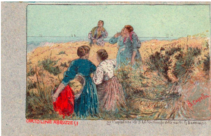
Fig. 3. Basilio Cascella, La cantatrice di S. Vito , collezione privata.

Le pagine letterarie di D'Annunzio si rendono a tratti didascaliche e propedeutiche alla comprensione di ciò che altri artisti hanno espresso con linguaggi diversi e in un ideale gioco in contrappunto imitato le stesse impressioni letterarie vengono spesso fissate in immagini visive. È il caso di una cartolina disegnata da Basilio Cascella, La cantatrice di S. Vito (fig. 3),