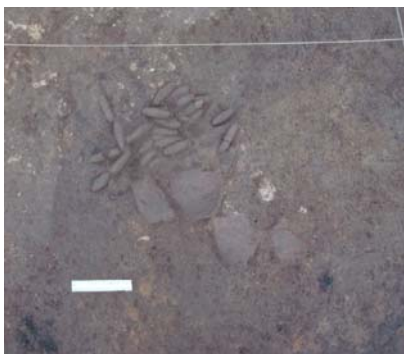
Fig. 3. Sa Osa, Cabras (OR). Accumulo di pesi da rete da G. CASTANGIA, Continuity and change in the nuragic rural landscape: the case of Sa Osa , cit., p. 23.

Oltre ai resti di pesci, il contesto di Sa Osa ha restituito elementi delle attrezzature da pesca quali un amo di bronzo, un arpione di osso e numerosi pesi da rete fusiformi o cilindrici 24 (fig. 2). Nel settore meridionale dell'area di scavo, 19 pesi integri e 11 frammentari sono stati ritrovati associati in un accumulo che sembra riconducibile al residuo di una rete da pesca abbandonata