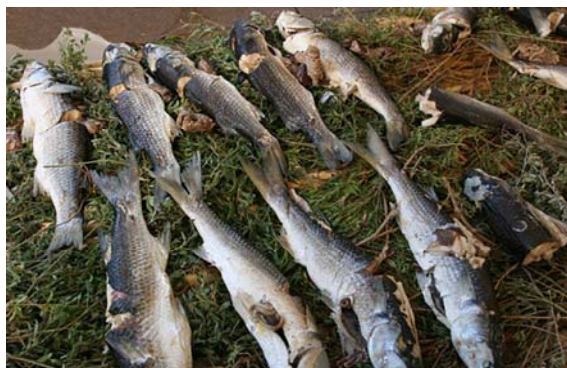
Fig. 4. Esemplari di Mugil cephalus salati e avvolti nella ziba per la preparazione della merca a Cabras (OR).

Nelle lagune costiere della costa occidentale della Sardegna, in particolare nei territori gravitanti sullo stagno di Cabras, viene ancora approntata la bollitura in acqua molto salata dei muggini ( Mugil spp. ) che vengono in seguito avvolti in un'erba alofila del genere Atriplex o Obione portulacoides L. nota anche come porcellana di mare, obione o ziba ed infine in un involucro di giunchi che tenga strettamente serrato il tutto ( merca o mreca ) e ne consenta la conservazione anche per periodi di un mese e più 31 (fig. 4).