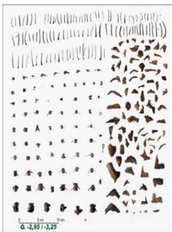
Fig. 1. Sa Osa, Cabras (OR). Resti di fauna ittica dall'interno del pozzo N (da I. SANNA, Sa Osa-Cabras (OR). I reperti organici del pozzo N , Tharros Felix IV, Roma 2011, pp. 239-248).

vertebre, spine e parti di cranio di diverse grandezze riferibili anche ad esemplari di taglia considerevole 23 (fig. 1).