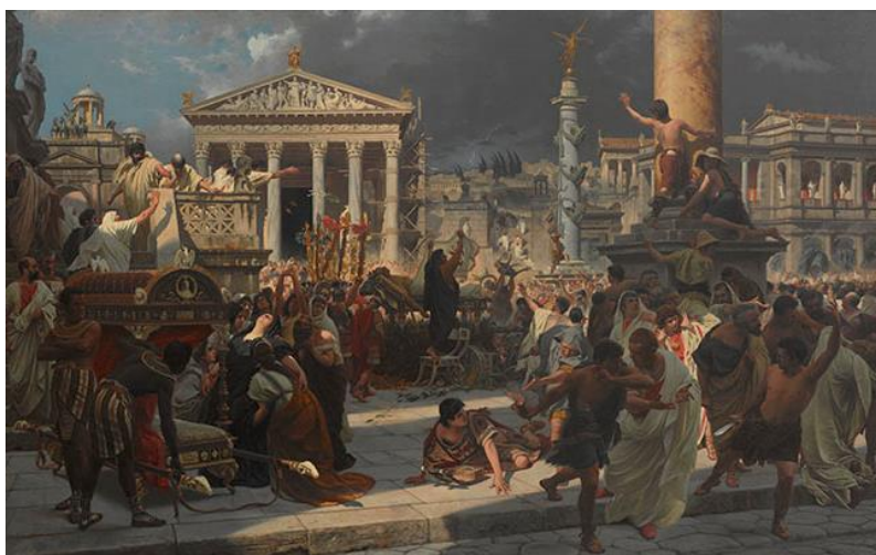
Fig. 2: Muerte César , Prospero Piatti, 1898. Museo Nacional de Bellas Artes, Santiago, Chile.