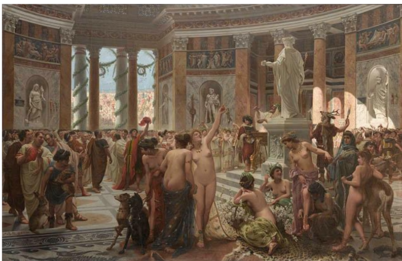
Fig. 3: Fiestas florales , Prospero Piatti, 1900. Museo Nacional de Bellas Artes, Santiago, Chile.

Otra pintura que llama nuestra atención es Primavera , del destacado pintor peruano Albert Lynch (1851-1912), quien se estableció en París en 1878, conociendo seguramente a Matte en esta ciudad 24 .