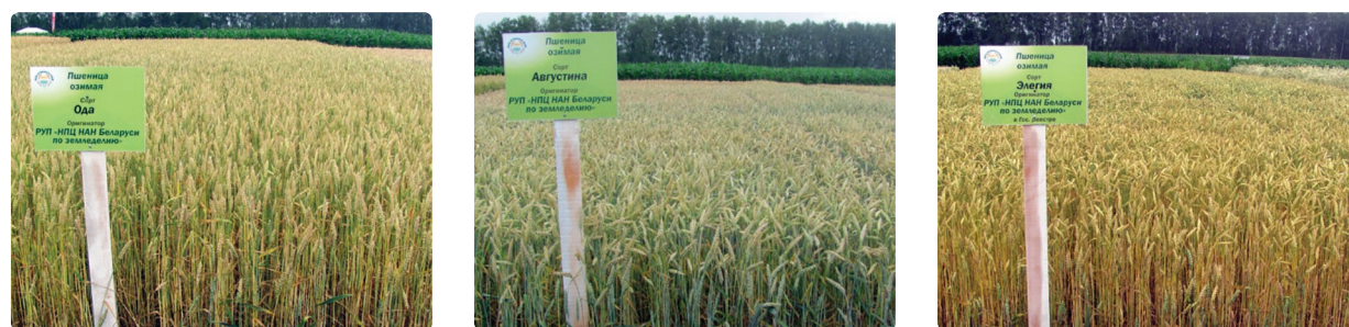
Рис. 4. Посевы озимой пшеницы сортов Ода, Августина, Элегия в экологическом сортоиспытании Брянского аграрного университета, Брянск, Россия, 2017 г.

В Государственном сортоиспытании РФ проводится изучение белорусских сортов Ода 2 и Элегия 16.