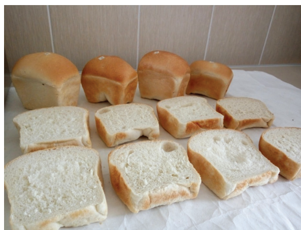
Рис. 2. Результаты пробной выпечки хлеба 4 образцов озимой пшеницы, Жодино, 2018 г.

Важным является то, что сорта белорусской селекции показывают хорошие результаты не только на почвах нашей республики, но и в экологических условиях других стран, например Германии. Сорта Спектр, Капылянка, Сюита и Узлёт изучались на территории Федеральной земли Нижняя Саксония (селекционная фирма Dieckmann GmbH, Ганновер, Германия), как показали результаты, все они превысили по урожайности контрольный немецкий сорт, а также другие изучавшиеся