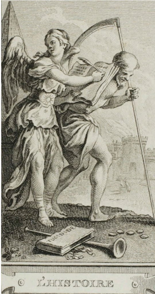
Imagen 2. L'histoire (H.F. Gravelot y Ch.N Cochin).

Las diferencias que distinguen entre sí a estas dos alegorías, la del grabado y la descrita por Benjamin, no son, pues, estructurales sino únicamente de contenido; son, sin embargo, diferencias sustanciales y fuertemente significativas. Subrayo dos de entre ellas, que me parecen especialmente importantes: