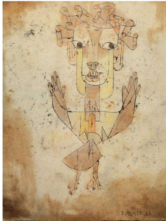
Imagen 1. Angelus Novus , (Paul Klee, 1920). Dibujo a tinta china, tiza y acuarela sobre papel. Museo de Israel. https://upload.wikimedia.org/wikipedia/commons/d/db/Klee-angelus-novus.jpg

bidimensional, a la vez encantador y enigmático, del ángel tranquilamente suspendido en el aire que presenta el cuadro de Klee. En mi opinión, esta falta de coincidencia parece indicar que lo que Benjamin hizo con el ángel de Klee no fue en realidad sólo cambiarle el nombre sino mucho más: sustituirlo por otro, un nuevo ángel, inventado por él. Pudiera decirse, incluso, que aquello que Benjamin tenía ante los ojos como imagen de partida, a la que su invención habría de someter a alteraciones considerables, no estaba en verdad en el cuadro de Klee sino más bien en un viejo grabado del siglo XVIII.