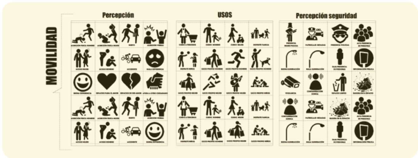
Gráfico 6. Variable de visibilidad.

Ahora bien, para esta investigación se presenta dos sujetos de estudio que evidencian la relación entre la geografía y el género.