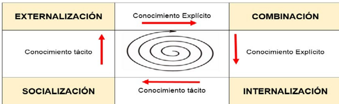
Figura 1. Espiral del conocimiento