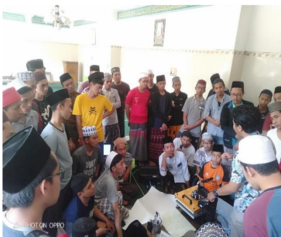
Gambar 3. Suasana pelatihan

Dari kegiatan sosialisasi, terjaring 75 santri yang berminat untuk mengikuti kegiatan pengabdian ini. Kegiatan pelatihan dilaksanakan di akhir bulan Juli selama 2 hari. Hari pertama berisi materi tentang kewirausahaan dan materi tentang Ekonomi Kreatif yang disampaikan secara bersama oleh tim pengabdian. Selain itu, di hari pertama ini juga disampaikan materi tentang dunia printing (sablon) dari yang sistem manual sampai berbentuk digital seperti sekarang ini. Hari pertama ditutup dengan melakukan praktek pencetakan gambar pada media kaos menggunakan teknik press poliflex. Hari kedua pelatihan diisi dengan pelatihan memindahkan gambar pada kertas sublimasi yang juga diprint dengan tinta sublimasi ke media mug dan kaos.