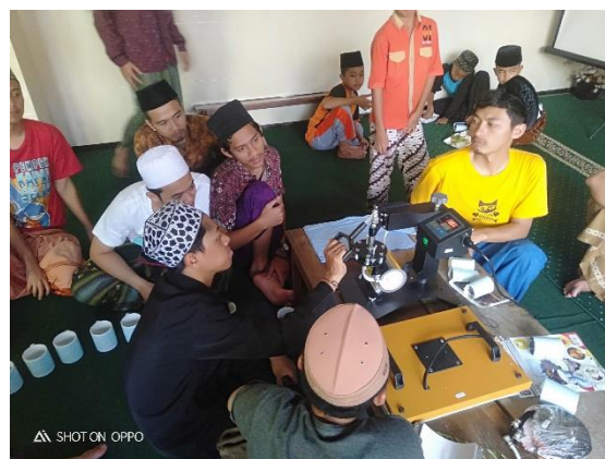
Gambar 4. Para santri melakukan praktik