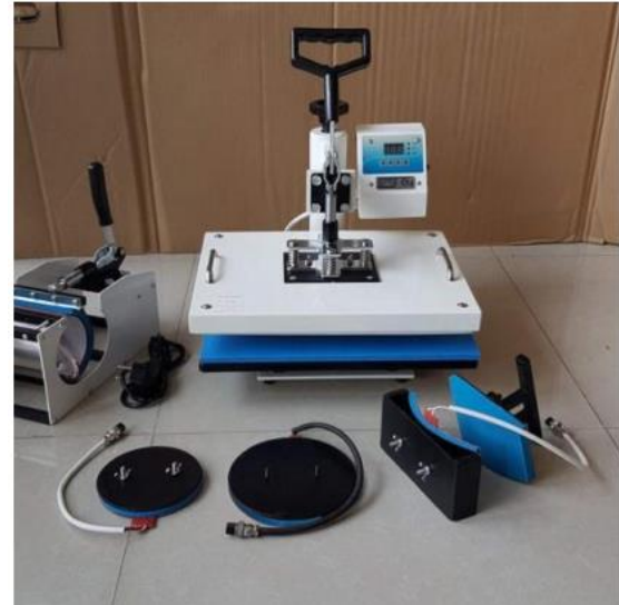
Gambar 2. Mesin Press 5 in 1

tahapan ini, santri akan dibekali dengan pengetahuan untuk digital printing di media seperti kaos, mug, topi, dan lain sebagainya. Selain itu, siswa juga akan dibekali kemampuan manajemen pengelolaan usaha. Alat yang digunakan dalam pelatihan ini adalah mesin press 5 in 1 seperti gambar berikut: