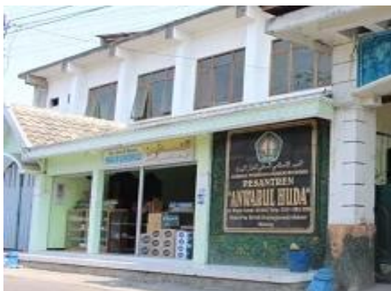
Gambar 6. Toko ATK milik PPAH