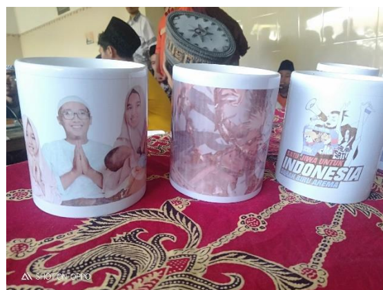
Gambar 5. Hasil Praktek pada Media Mug

Pelaksanaan pengabdian kepada masyarakat terkait dengan peningkatan wawasan kewirausahaan kepada para santri di PPAH mendapatkan hasil yang cukup memuaskan. Hasil survey dengan menggunakan teknik kuesioner (Pre-test dan Post-test) menunjukkan bahwa setelah pelatihan, keinginan para santri untuk menjadi seorang santripreneur dan pengetahuan mereka tentang kewirausahaan meningkat. Kuesioner ditujukan kepada para santri yang menjadi peserta pelatihan, yakni sebanyak 75 orang. Hasil kuesioner tersebut ditunjukkan oleh tabel 1.