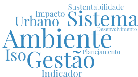
Quadro 1. Artigos científicos abordando a gestão ambiental, publicados no ano de 2010, depositados na base de dados Scielo.

A Figura 2 mostra os termos mais recorrentes e constantes no levantamento das palavras-chave dos textos científicos analisados. Esta figura evidencia as palavras: gestão, ambiente, sistema, urbano, ISO e indicador.