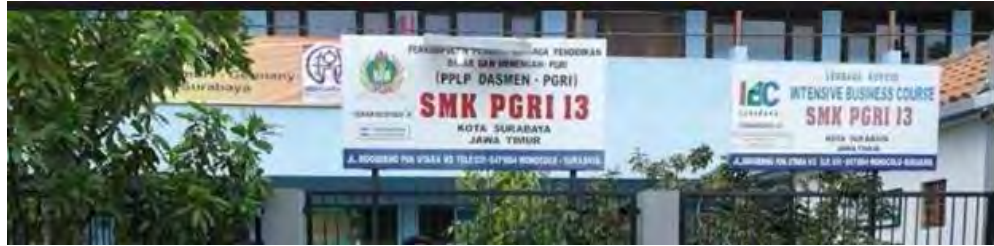
Gambar 1.1. SMK PGRI 13 Surabaya.

bahkan maintenance. Agar hasil kegiatan pengabdian kepada masyarakat mempunyai keberlanjutan, maka keikutsertaan Guru pendamping sangat diperlukan. Gambar 1.1. menunjukkan kondisi SMK PGRI 13 Surabaya.