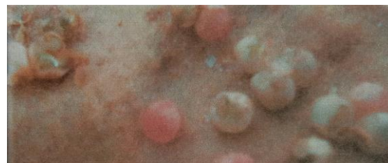
Gambar 3. Telur Pomacea canaliculata Lamarck yang mengalami plasmolisis dan robeknya cangkang.

Konsentrasi ekstrak biji A. catechu memberikan pengaruh pada kesintasan telur P. canaliculata . Rata-rata presentase mortalitas tertinggi diperoleh pada perlakuan P5 (100%) sedangkan presentase mortalitas terendah oleh perlakuan P0 (0%) terlihat pada Grafik 1. Hal ini diduga apabila ada penambahan konsentrasi maka kematian juga semakin bertambah dengan demikian semakin tinggi konsentrasi ekstrak biji A. catechu semakin tinggi pula kadar arecoline dan senyawa bioaktif lain yang larut didalamnya.