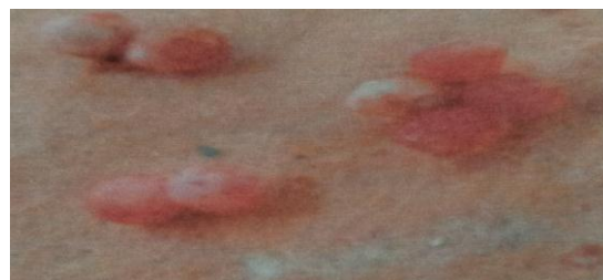
Gambar 2. Telur Pomacea canaliculata Lamarck saat pemberian ekstrak biji pinang.