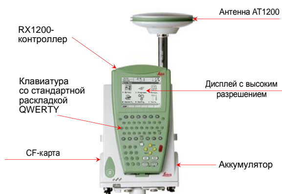
Рис. 3. GPS-приемник Leica GX1230

GPS-наблюдения на геодинимических реперах в районе Краснослободского разлома выполняли сетевым методом. Использовали режим измерений «Статика». Длину эпохи наблюдений устанавливали равной 30 с, выбирали исходя из рекомендаций фирмы-изготовителя GPS-оборудования и технических возможностей оборудования. Угол возвышения спутников, с которых принимали сигналы (угол засечки), устанавливали равным 10–15 град. (Угол 10 град. использовали на четвертом репере для увеличения числа принимаемых спутников, поскольку на этом репере условия приема GPS-сигналов были далеки от идеальных.) С целью исключения искажений, вносимых расположением фазового центра GPS-антенны, на каждый пункт сети всякий раз устанавливали один и тот же GPS-приемник и ориентировали его всегда в одном и том же направлении.