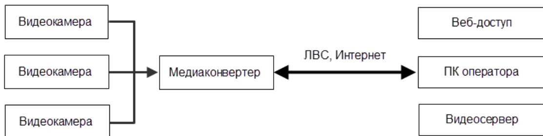
Рис. 2. Структурная схема центрально-распределенной системы на базе аналоговых камер с медиаконвертером

Устаревшие аналоговые камеры подключаются к сети через медиаконвертеры и видеорегистраторы с сетевым выходом, ПК с платой видеозахвата (до 16 камер) [2, 17] (рис. 2 и 3). Когда подключение происходит через ПК с платой видеозахвата, ПК может выступать в роли видеосервера.