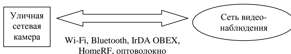
Рис. 4. Канал передачи данных от уличной камеры

В уличных камерах на столбах для защиты от грозы используются оптоволокно и беспроводные технологии: Wi-Fi, Bluetooth (дальность 50 м), IrDA OBEX, HomeRF (рис. 4) [2, 18, 19]. Наиболее популярна технология Wi-Fi несмотря на то, что скорость передачи данных в ней в значительной степени зависит от расстояния, погодных условий, наличия препятствий на пути сигнала, числа подключенных клиентов [18].