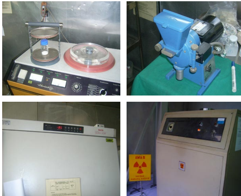
Gambar 1. Bransonic, Grinder, Deep Freezer, Gamma Chambe.

dalam Screw Cup Steril , disonikasi dengan alat Bransonic, dicuci dengan aquades steril untuk menghilangkan H_2O_2 , direndam dalam larutan Propanol-2 70% selama 3 jam sambil disonikasi dengan Bransonic, kemudian dicuci dengan aquades untuk menghilangkan Propanol-2 70%.