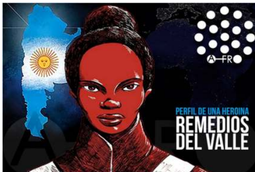
Ilustración para las celebraciones del día 8 de noviembre.

A los argentinos se les gusta decir que sus antepasados vinieron en “los barcos” haciendo referencia a los barcos de la inmigración europea. Sin embargo, es importante traer a la escena de la historia nacional la existencia de otros barcos, los barcos de la trata negrera. Sobre los barcos de trata esclavista, cabe destacar que los puertos en el Río de la Plata, incluso lo de Buenos Aires, desde su fundación en 1580, fueron considerados según historiadores del proyecto la Ruta del Esclavo de la UNESCO puertos importantes en la trata negrera. No se sabe exactamente cuántos barcos entraron, puesto que no todos eran registrados ya que muchos barcos ingresaron a esos puertos de manera ilegal. Pero, además esos puertos eran estratégicos en la comercialización de los esclavizados que eran llevados por tierra desde los estados brasileños Rio Grande del Sur y Mato Grosso y también de Uruguay, Bolivia y Paraguay.