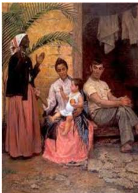
La Redención de Cam de Modesto Brocos y Gómez (1852-1936)

En el censo de 1887 hubo un cambio en el modo de registro racial de la población, que pasó a tener solamente dos opciones de “raza” 1 : negra y blanca. En los censos anteriores hubo más categorías étnico-raciales como: blanco, negro, pardo/moreno, indio y mestizo. Por lo tanto, el censo de 1887 sugiere una explicación mejor para un resultado tan raro de 1,8%, puesto que las categorías pasaron de ser cinco a solamente dos. De esta manera, la gran mayoría de los mestizos que socialmente eran considerados “trigueños” 2 , pasaron a ser contados como blancos. Además, el censo de 1887 fue el último del siglo XIX que contabilizó la población por variables de “raza”. Después de ese censo, solo en 2010 el Estado volvió a contabilizarlos, más adelante veremos cómo eso se dio.