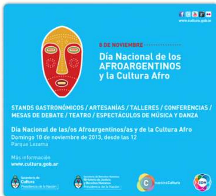
Flyer de la 1ª Celebración del 8 de noviembre “Día Nacional de las/los Afroargentinas/os y de la Cultura Afro”.

Una conquista de ese arduo trabajo se puede ver en la inclusión, en el Censo de 2010, aunque no sea de manera plena, y en la Ley 26.852, de 2013 que instituyó el día 8 de noviembre como el “Día Nacional de los/as afroargentinos/as y de la Cultura Afrodescendiente”. Ley que también es conocida como Ley María Remedios del Valle 3 .