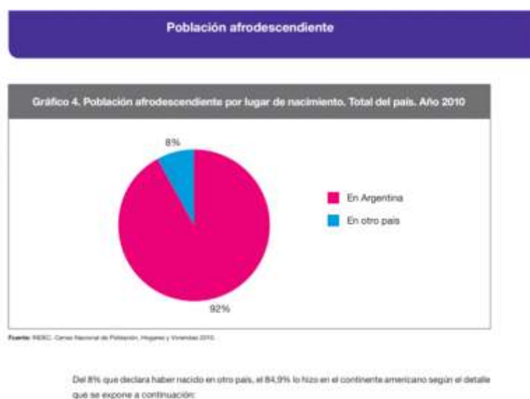
Gráfico del Instituto Nacional de Estadísticas y Censos (INDEC) República Argentina 2010

Entonces, luego de mucha batalla, en 2010 los afrodescendientes volvieron a ser censados, y aún así, la pregunta sobre la afrodescendencia salió en apenas 10% de las encuestas y según los datos del Censo 2010 en Argentina hay 149.493 personas que se autorreconocen afrodescendientes, poco más de 0,37%. En Argentina, la mayoría de los afroargentinos son descendientes de Cabo Verde, Senegal, Congo, Angola, Mozambique, Camarún, de afro-latinoamericanos y caribeños. Además, cabe destacar, que los resultados del censo indican que solo el 8% de los afrodescendientes censados no nacieron en Argentina, es decir que la mayoría son argentinos, lo cual contradice la extranjerización de los mismos.