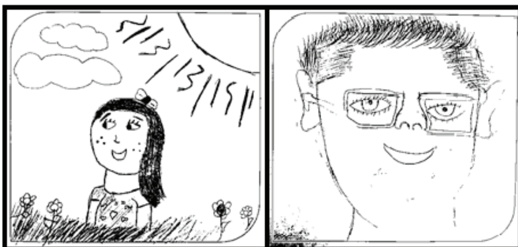
Figura 4 – Ilustrações sobre o tema “Assim como o menino, quem sou eu?”

Essa mesma atividade também foi aplicada na Nova Escola e assim como na escola anterior, os alunos demonstraram facilidade para se reconhecer como indivíduo na sociedade e realizar sua caricatura no papel (figura 4).