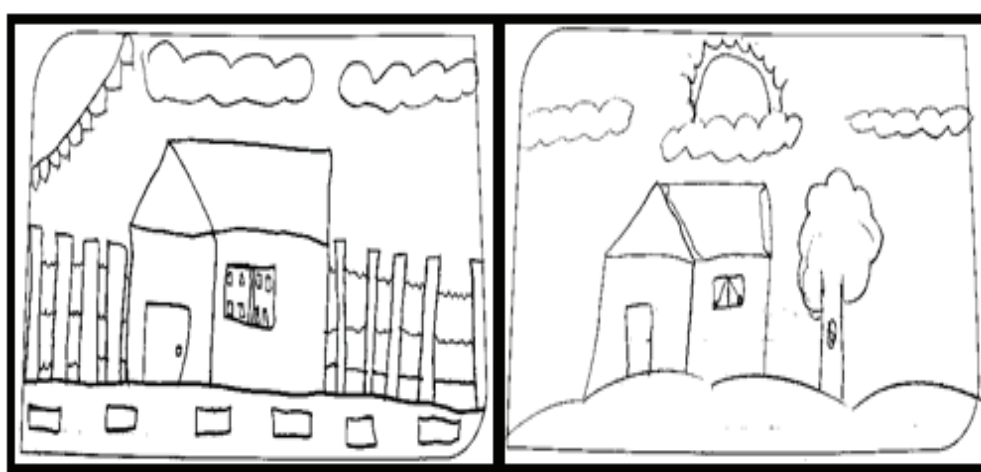
Figura 3 – Ilustrações sobre o tema “Este é o lugar onde eu moro