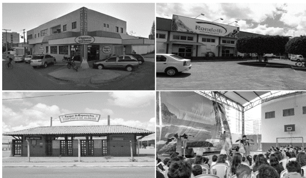
Imagem 2 – Lugares selecionados do Bairro Candeias

Para esses alunos foram projetados, através do Datashow, quatro imagens de lugares localizados no bairro Candeias (imagem 2).