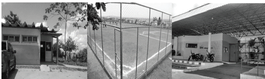
Imagem 1 – Lugares selecionados do Bairro Ibirapuera

Foram expostas aos alunos três imagens de lugares do bairro Bruno Ibirapuera (imagem 1).