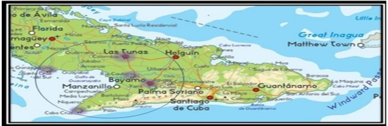
Mapa No 1: Asentamientos humanos que recibían el periódico

Explícitamente queda demostrado que la dirección del periódico pretendía que la publicación prosperara paralelamente al crecimiento poblacional, con el fin de informar a otros lugares los avances de la ciudad de Manzanillo, lo cual se concretaría al llegar la publicación a los predios del entonces Bayamo, Las Tunas, Jiguaní, Guisa, Cauto-Embarcadero, Santa Cruz y otras localidades, que tendrían la dicha de acceder de manera gratuita -por esta vez- al periódico. (Mapa No 1).