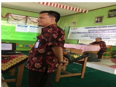
Gambar 2. Tim sedang menyampaikan materi tentang pembuatan content e-learning berbasis Edmodo.

Setelah pembukaan pengabdian, tahap selanjutnya adalah penyampaian materi tentang pembuatan content e-learning oleh tim.