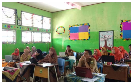
Gambar 4. Peserta pengabdian serius dan focus menerima materi yang disampaikan tim pengabdian.

Pada saat proses pengabdian peserta sangat serius dan fokus dalam menerima materi yang disampaikan oleh tim pengabdian. Selain itu proses diskusi juga berjalan dengan baik antara tim pengabdian dengan peserta pengabdian. Beberapa peserta pengabdian memberikan pertanyaan kepada tim pengabdian. Pelaksanaan kegiatan pengabdian seperti ditampilkan pada Gambar 4.