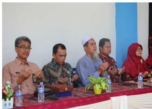
Gambar 1. Kepala Dinas Pendidikan Kab Muara Jambi, Dekan dan Wakil Dekan BAKSI FKIP menghadiri acara pembukaan pengabdian Prodi Pendidikan Fisika FKIP Universitas Jambi

Kegiatan pengabdian ini dilaksanakan pada hari Selasa tanggal 20 Agustus 2019 yang bertempat di SMPN 7 Kabupaten Muaro Jambi, Provinsi Jambi. Peserta kegiatan pengabdian masyarakat ini terdiri dari dua belas guru-guru anggota MGMP IPA Rayon Jaluko Kab. Muaro Jambi, Provinsi Jambi. Kegiatan pengabdian diawali dengan pembukaan yang langsung dihadiri oleh kepala dinas pendidikan Kab. Muara Jambi dan Dekan FKIP Universitas Jambi.