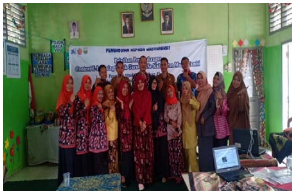
Gambar 5. Foto bersama tim pengabdian dan peserta pengabdian